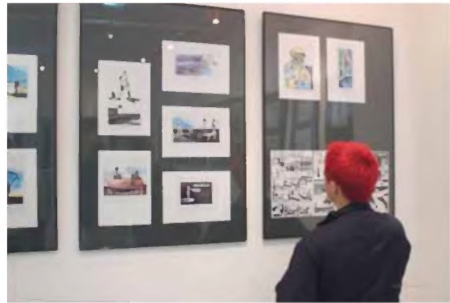
Wystawa 3xLegus, fotoreportaż Bolesław Słomkowski