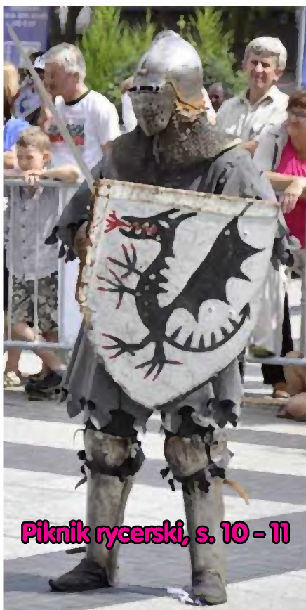
Piknik rycerski, s. 10 - 11