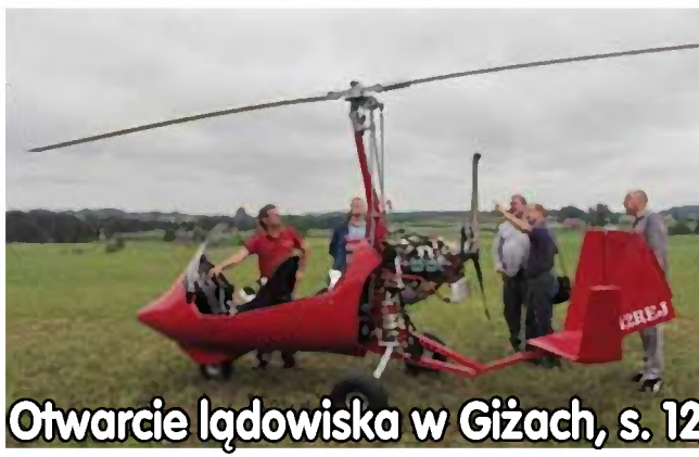
Otwarcie lądowiska w Gizach, s. 12