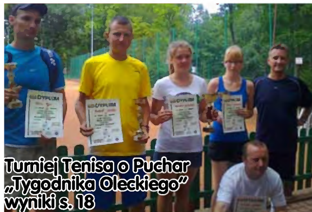
Turniej Tenisa o Puchar „Tygodnika Oleckiego” wyniki s. 18