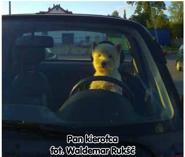
Pan kierowca

Przechodząca kryzys gospodini domowa przeprowadza się z Nowego Jorku do San Francisco, gdzie ponownie nawiązuje kontakt ze swoją siostrą. Allen dawno nie był tak zabawny i dojmująco smutny. Wiadomo, że jest mizantropem pozbawionym złudzeń, który od lat powtarza, że szklanka jest zawsze bardziej pusta niż pełna. W najnowszym filmie znów ze smutkiem patrzy na swych bohaterów, ale ton filmowego trefnisa staje się poważniejszy niż zazwyczaj. Bo „Blue Jasmine” to opowieść o tym, że jedynym sposobem na przetrwanie jest wiara w złudzenia, które nigdy się nie spełniają