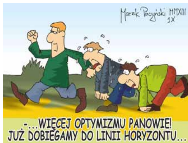
rys. Marek Pacynski

Squash będący grą w Polsce stosunkowo nową zdobywa coraz większą popularność. Podobnie jest i w Olecku. By wyjść naprzeciw oczekiwaniom jej fanów i przyciągnąć nowe osoby MOSiR Olecko inauguruje rozgrywki Amatorskiej Ligi Squasha. Serdecznie zapraszamy do udziału!