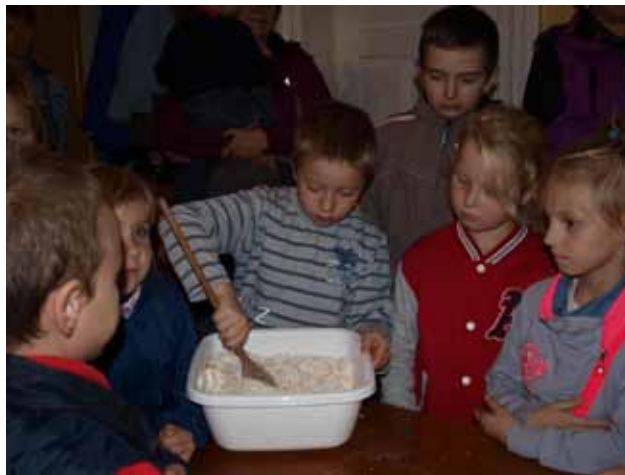
Dzieci przygotowują ciasto, z którego powstanie chleb

Pieczenie chleba to w ogóle jakby oddzielna historia. Każdy z uczestników chciał przynajmniej wykonać jakąś