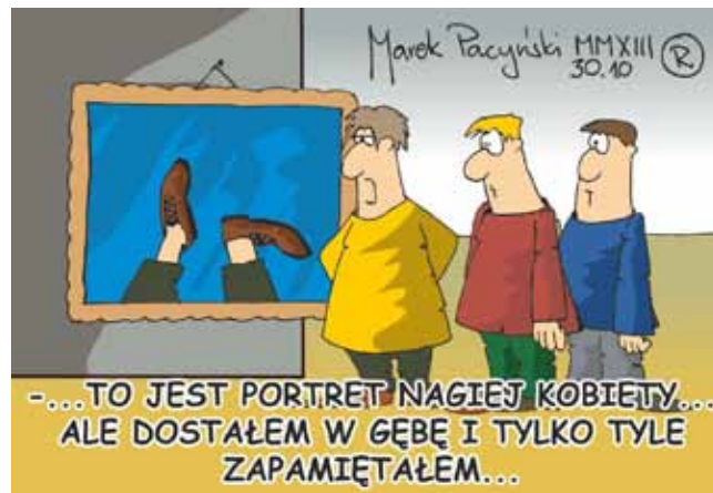
rys. Marek Pacyński

f) uchylającej uchwałę w sprawie przyjęcia „Programu pomocy de minimis dla przedsiębiorców inwestujących lub tworzących nowe miejsca pracy na terenie Gminy Olecko”,