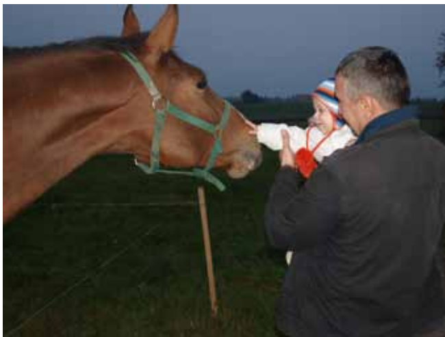
Najstarszy uczestnik projektu ma 84 lata, najmłodszy niespełna roczek

Wszystkie zabytki oraz działania zostały uwiecznione na