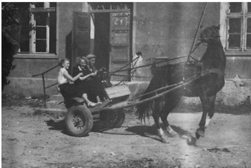
Przed świetlicą w Kukowie

K u k o w o było bardzo piękne. Czysto, wszędzie pozamiatane. Spalone były