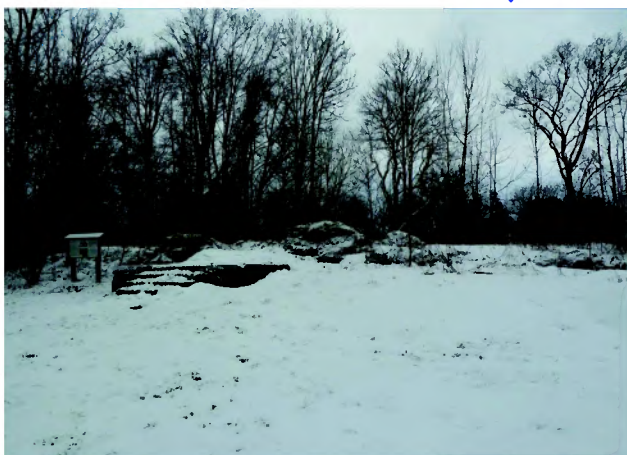
Dojazd: Olecko - Filipów - Nowa Pawłówka - Hańcza.

Nad brzegiem jeziora Hańcza (najgłębszego w Polsce: 108,5 m) istniał folwark Stara Hańcza. Jego powstanie datuje się na wiek XVII. Obejmował on praktycznie północną część obecnego Suwalskiego Parku Krajobrazowego i jego otuliny. Otaczał go park i ogród, przedzielony, zachowaną do dzisiaj aleją lipową (pomnik przyrody). Od zachodu usytuowane były budynki gospodarcze, stawy rybne i wazywnik.