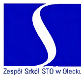
Zespół Szkół STO w Olecku