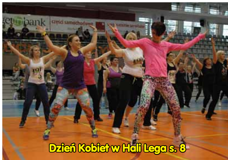
Dzień Kobiet w Hali Lega s. 8