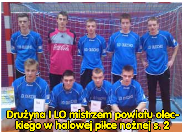
Drużyna I LO mistrzem powiatu oleckiego w halowej piłce nożnej s. 2