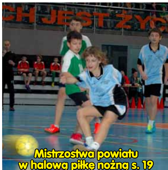
Mistrzostwa powiatu w halową piłkę nożną s. 19