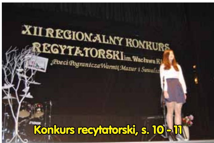
Konkurs recytatorski, s. 10 - 11