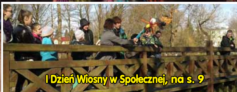
I Dzień Wiosny w Spółecznej, na s. 9