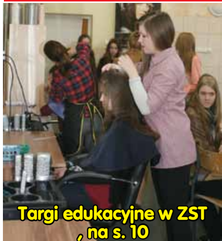
Targi edukacyjne w ZST , na s. 10