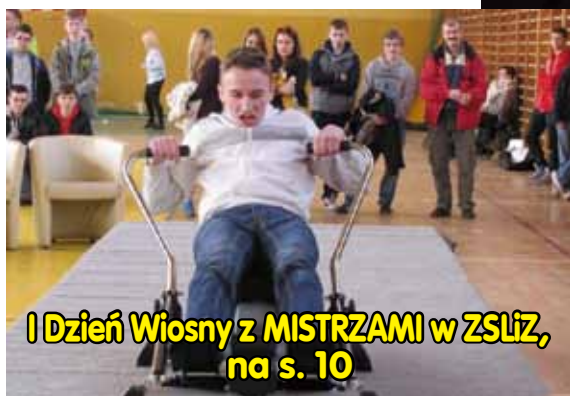
I Dzień Wiosny z MISTRZAMI w ZSLiZ, na s. 10