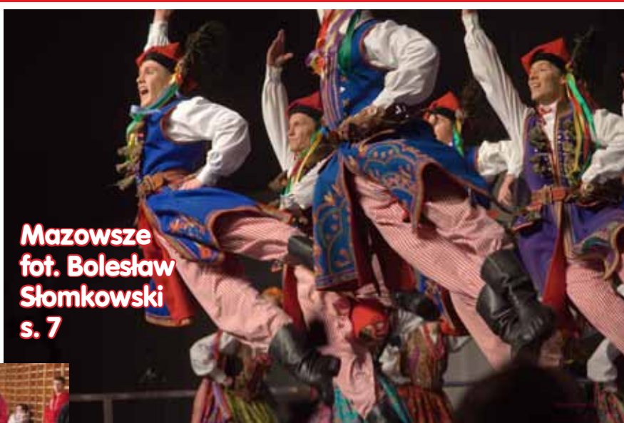
Mazowsze s. 7