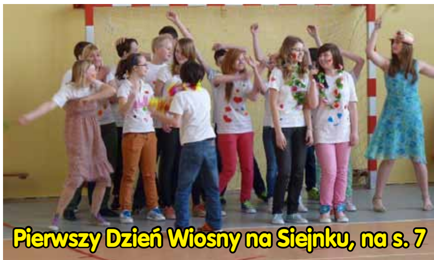
Pierwszy Dzień Wiosny na Siejniku, na s. 7