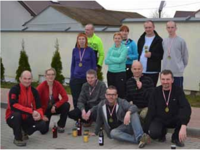
23 marca biegacze ze Stowarzyszenia Olecko Biega wzięła udział w I Wiosennym Biegu po Miód w Gielczynie k. Łomży, na dystansie 10 km. O to wyniki: