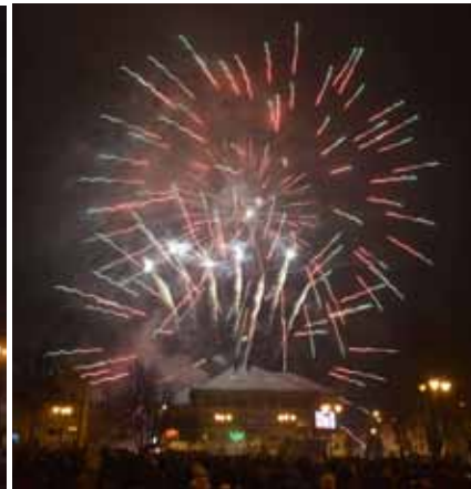
Olecczanie tradycyjnie 1 stycznia o 17.00 zebrali się na Rynku, by pokazem ogni sztucznych przywitać Nowy Rok (fotografie Bolesława Słomkowskiego)