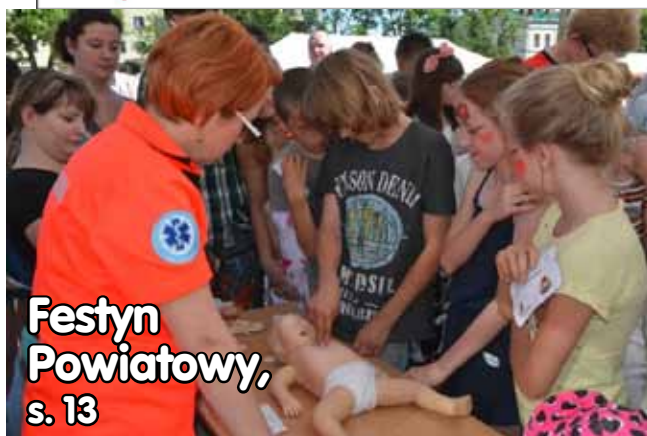
Festyn Powiatowy , s. 13