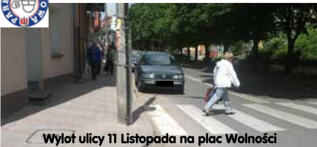
Wylot ulicy 11 Listopada na plac Wolności