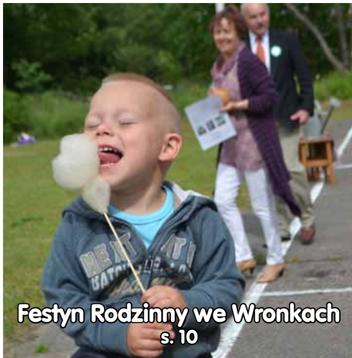
Festyn Rodzinny we Wronkach s. 10