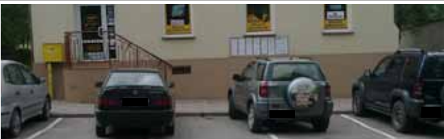
Okolice Urzędu Miejskiego

Do rozlosowania: gry komputerowe, książki, pióra wieczne, długopisy, akcesoria szkolne, modele do sklepania, magnesy, smycze, pocztówki, gry logiczne itp.