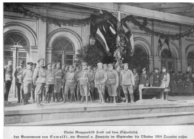
General Paul von Rennenkampf ze sztabem w Suwałkach

Wojska rosyjskie otrzymały rozkazy, aby osiągnąć pozycje wyjściowe do ofensywy 13 sierpnia 1914 r.