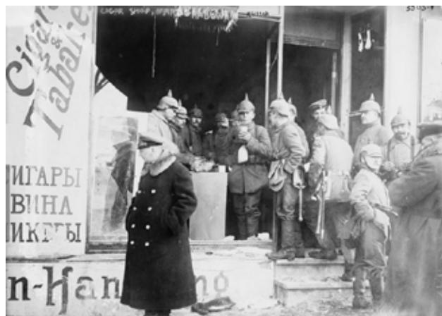
Żołnierze niemieccy odbierają przydziały papierosów i tabaki

Armia Narwi - w składzie 5 1/2 - korpusów również z silną jazdą, zebrawszy się pod osłoną umocnień Narwi i Biebrzy, miała obejść jeziora Mazurskie od południa.