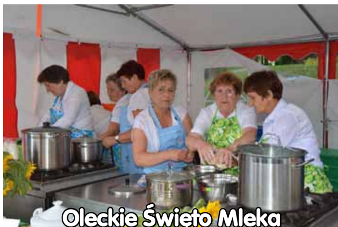
Oleckie Święto Mleka fotoreportaż Józef Kunicki, a. 8