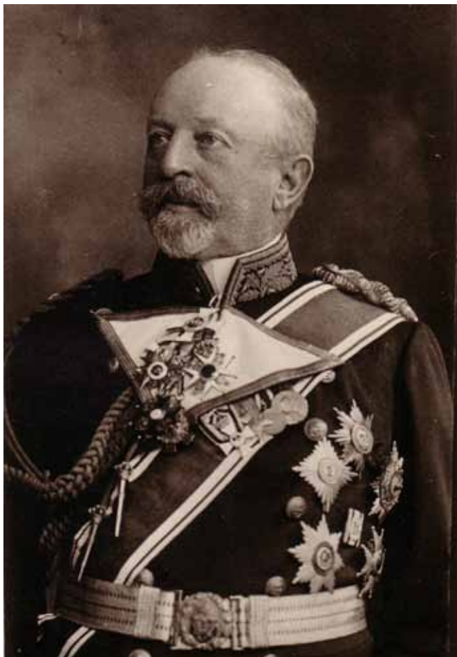
Niemiecki general Maximilian von Prittwitz und Gaffron (1848-1917)