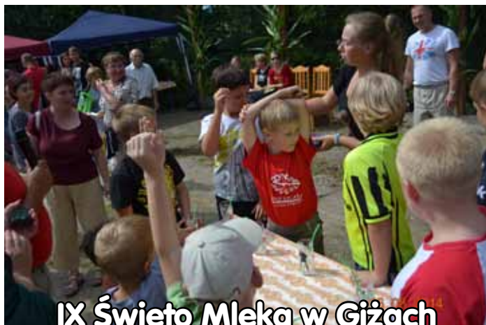
IX Święto Mleka w Giżach fotoreportaż Mieczysław Ronkowski, s. 9