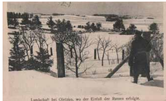
Obrazek z powiatu oleckiego. Zdjęcie zrobione zimą, gdzieś na granicy rosyjsko niemieckiej. (Niemiecka pocztówka patriotyczna)

Niepokój wśród ludności przygranicznej był oczywiście duży. Spodziewano się zbrojnych oddziałów rosyjskich stacjonujących przy granicy. Niepokój wzrósł, gdy niemiecki samolot zwiadowczy został 3 sierpnia ostrzelany z terenu Rosji w okolicach Cimoch. Wszyscy zdawali sobie sprawę z tego, że Rosjanie obstawili granicę. Natomiast na północny okręg wojska rosyjskiego na granicy nie było. patroly kawalerii niemieckiej zapuszczały się więc aż do Filipowa.