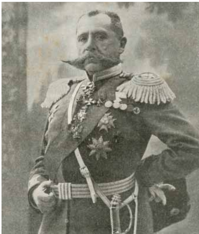
Rosyjski general Paul von Rennenkampf

Aby zrównoważyć koncentrację rosyjskiej 1 Armii na terenie Litwy jednostki niemieckie zajęły pozycje w kierunku na północny-wschód: I Korpus Rezerwy na linii rzeki Węgorapa do Jeziora Mamry, XVII Korpus w rejonie Insterburga