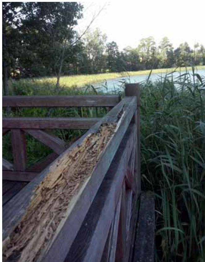
Rozsypana się barierka punktu widokowego na jezioro umiejscowione w Sedrankach