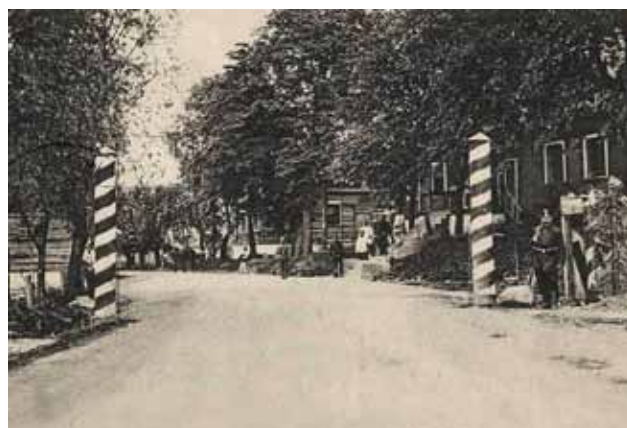
Granica po stronie niemieckiej w Lipówce

Wszyscy liczyli, że wojna trwać będzie krótko, jak w 1870 roku podczas batalii przeciwko Francji i zakończy się całkowitym pogromem nieprzyjaciół.