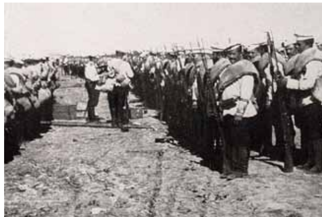
żołnierze piechoty rosyjskiej

Dowódca 2 Armii Samsonow przewidując, że rozbite i zmęczone wojska niemieckie będą dążyły do walnej bitwy, postanowił przesunąć swoje siły bardziej na zachód, aby odciąć niemieckiej 8 Armii drogę odwrotu za Wisłę.