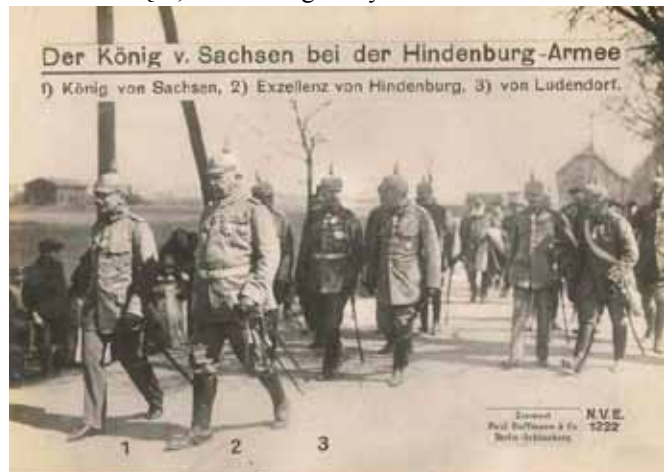
König von Sachsen wizytuje wojska generała Hindenburga. Trzeci z kolei idzie generał von Ludendorff

Uderzeniu niemieckiemu sprzyjał też fakt, że dowódca rosyjskiej 2. Armii generał Samsonow przebywał aż do 26 sierpnia w Ostrołęce, daleko od głównych sił.