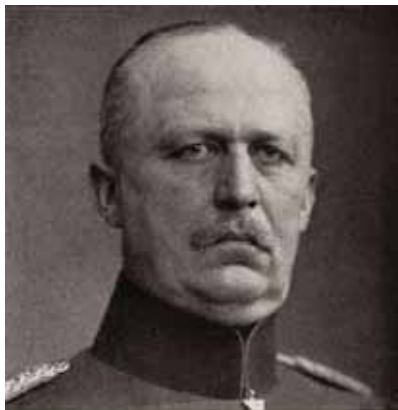
General Ludendorff, der Generalfeldmarschall Hindenburgs

General Samsonow, w odróżnieniu od generała Rennenkampfa , nie znał ani okolicy, ani też nie łączyły go więzy zażyłości z własnym wojskiem i sztabem