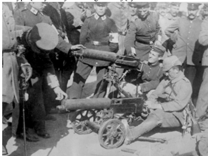
niemiecki karabin maszynowy systemu Maxim. Najpopularniejsza broń automatyczna wszystkich armii biorących udział w I wojnie światowej

Położony na wioskę ogień wielu baterii, jak również przewaga liczebna nacierających nie załamały obrońców. Szczytniejszy strzelcy rzadko chybiaли. Długo trzymali Rosjan na dystans, nie pozwalając im zbliżyć się do swych stanowisk. W rozsypkę szły kolejne szeregi atakujących.