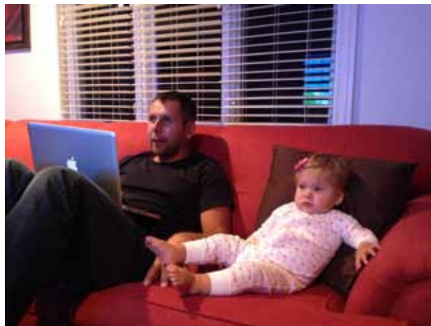
Lia i tata oglądają dobranocę

Kolację zakończyło meksykańskie piwo o nazwie „Modelo”. Dobrze. Potem córka dała mi jakiś syrop nasenny. Po to, jak powiedziała, by mój organizm płynnie przeszedł na czas chicagowski.