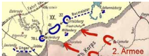
sytuacja 2. Armii Samsonowa przed bitwą pod Tannenbergiem

W wyniku manewrów obu przeciwników naprzeciw siebie stało 150 tysięcy żołnierzy niemieckich i 210 tysięcy rosyjskich.