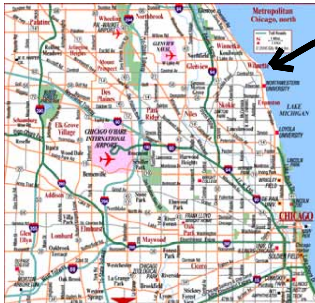
Mapa północnej części aglomeracji Chicago. Wilmette zaznaczone strzałką w górnym prawym rogu mapki. Lotnisko O'Hare w centrum.

Położyłem się w wygodnym łóżku... i obudziłem o 7.20 rano.