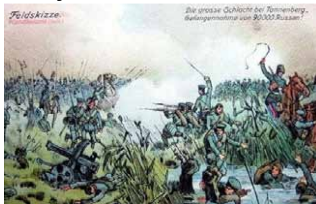
bitwa pod Tannenbergiem. Niemiecka pocztówka propagandowa

Po ujawnieniu zamiarów rosyjskich zdecydowano się więc na szybkie przerzucenie XVII. Korpusu von Mackensena i I. Rezerwowego Korpusu von Belowa z frontu północnego i skierowanie ich przeciwko prawemu skrzydłu armii gen. Samsonowa .