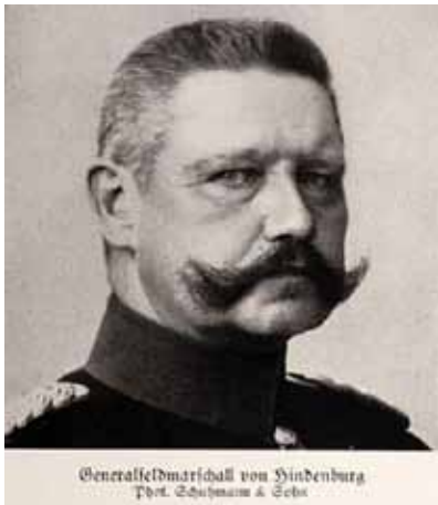
Generalfeldmarschall von Hindenburg