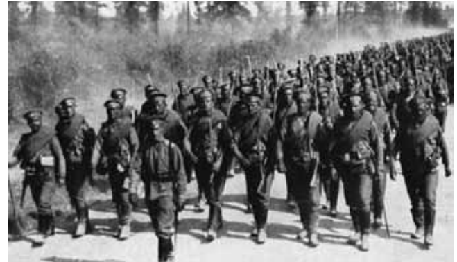
wojsko rosyjskie w marszu

6 listopada 1914 roku wojska rosyjskie ponownie zajmują Olecko