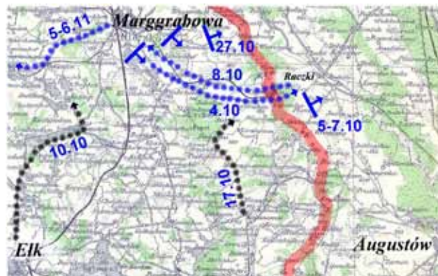
sytuacja strategiczna między 4 października, a 27 października 1914 roku

Kiedy kawaleria rosyjska rozpoczęła natarcie na odkrytą południową flankę dywizji i zagrażała tyłom, front został cofnięty na wschodzie i południu powiatu oleckiego.