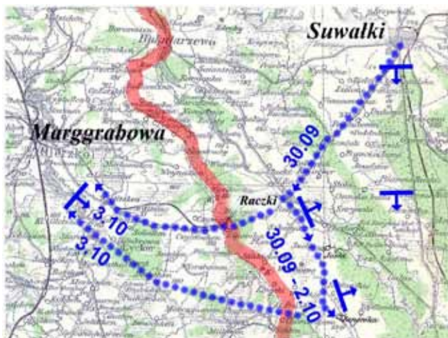
sytuacja strategiczna między 30 września, a 3 października 1914 roku