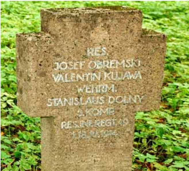
mogiła żołnierska w Wilkasach

17 października niemiecki 25 Korpusu Rezerwy uderzyła na Rosjan z okolic Ełku. Ten manewr spowodował wycofanie Rosjan.