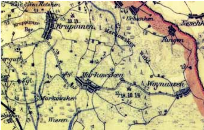
niemiecka mapa okolic Markowskich

17 października niemiecki 25 Korpusu Rezerwy uderzyła na Rosjan z okolic Ełku. Ten manewr spowodował wycofanie Rosjan.