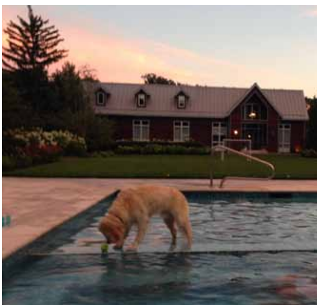
Szczęśliwy Ezzy w brodziku dla dzieci z ulubioną tenisową piłką. W głębi dom w stylu norweskim.

Łóżko, które miałem tam w tym ciepłym i radosnym domu było bardzo wygodne. „Zobaczysz, że za nim zateśkniesz” – powiedziała mi córka. I teraz, gdy piszę te słowa właśnie za nim zateśkniałem.