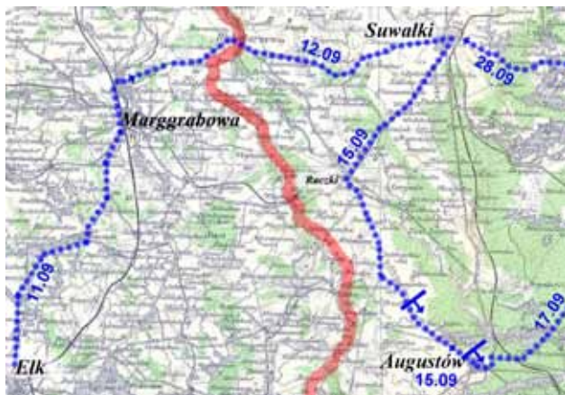
sytuacja strategiczna między 11, a 28 września 1914 roku

Niemcy przegrywają bitwę pod Augustowem i wycofują się do Prus Wschodnich. Rosjanie zajmują Augustów. Odwrót niemiecki następuje również spod Osowca.