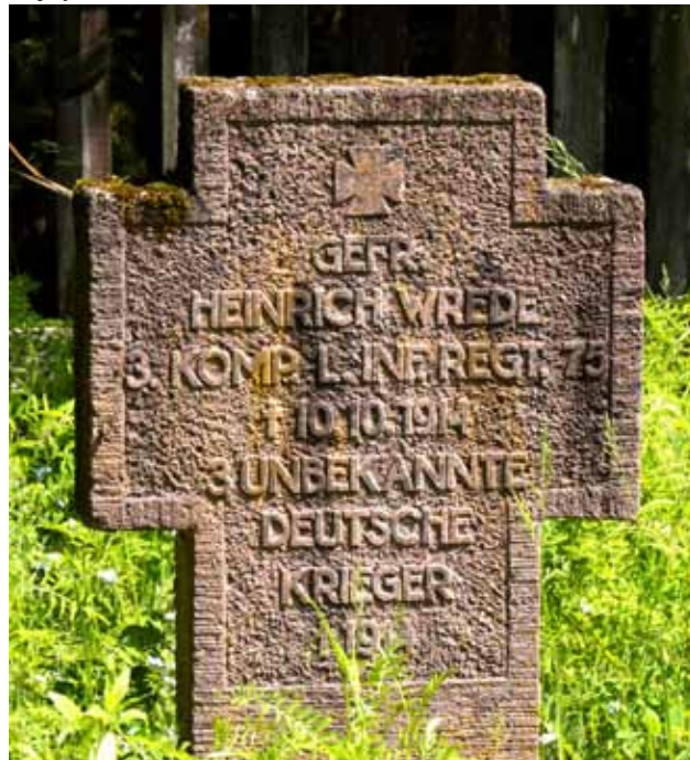
mogiła żołnierska w Zajdach

10 października 3 Brygada Landwehry przedarła się pod Zajdy.