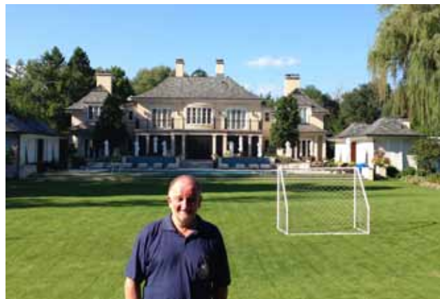
Za mną dom w stylu kolonialnym, przed nim basen, a bezpośrednio za mną boisko do piłki nożnej