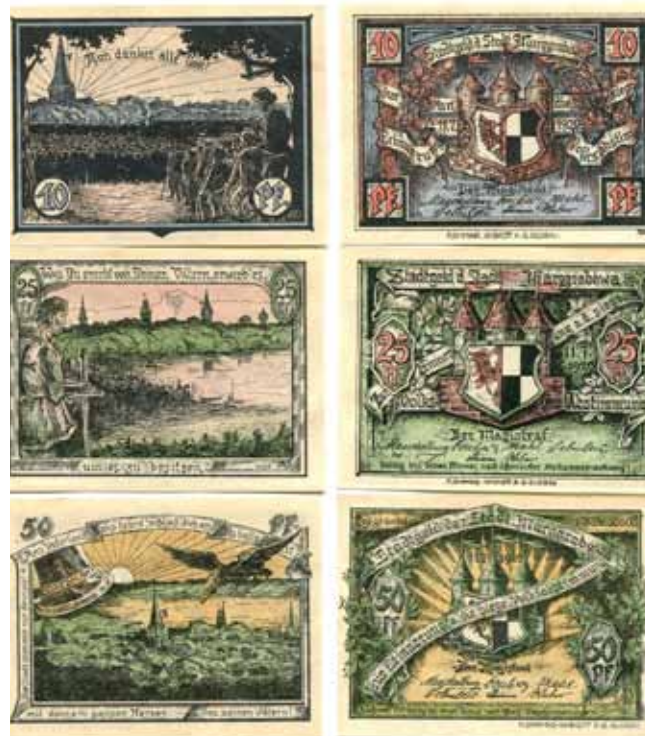
Tak wyglądały wprowadzone podczas wojny pieniądze zastępcze. Notgeld

Rozwinął się, również w Olecku, nielegalny handel żywnością. BYŁ on prowadzony po zawyżonych cenach przez tych, którzy skupowali masło, jaja i drób u gospodarzy, a potem je sprzedawali w mieście.