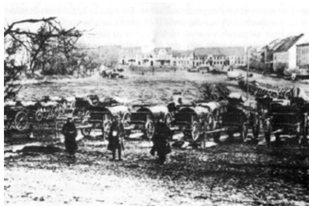
Tabory wojsk niemieckich na Rynku. Fotografia z 1915.

Rekwirowali też w okolicznych wioskach młockarnie i zwyczajny sprzęt rolniczy jak: pługi czy brony. Rabowali również bydło, które gnali stadami przez miasto na wschód. W Filipowie zgromadzono fortepiany z całych Prus Wschodnich.