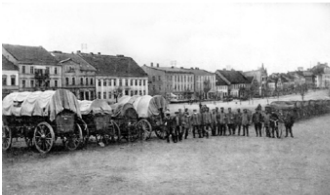
Tabory wojskowe na oleckim Rynku. Zdjęcie z 1900 roku.

Zanim ich pociąg dotarł do dalekiego Astrachania, to po kilkanaście dni spędzali przy głodowych racjach żywnościowych, w zwyczajnych celach więziennych i koszarach wojskowych.