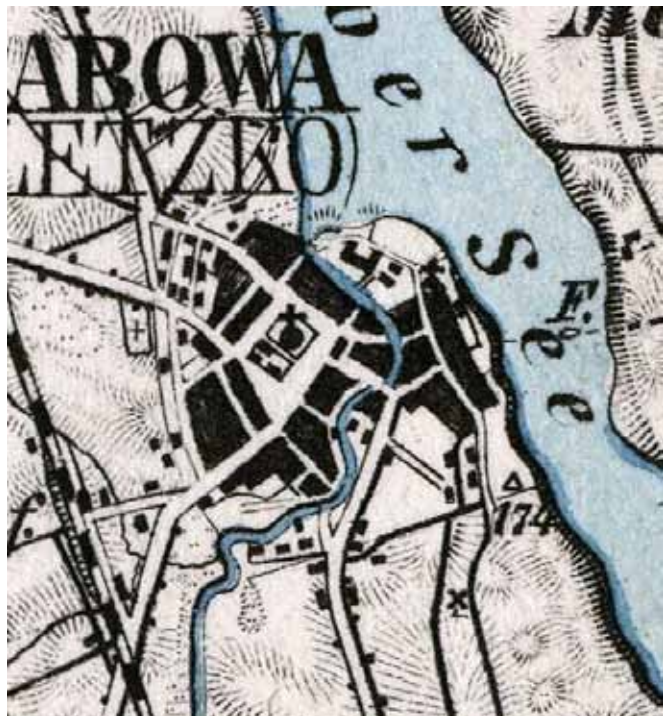
Margrabowa (Olecko) na wojskowej mapie wydanej w 1893

Widać na niej, że miasto praktycznie kończyło się na północy dzisiejszą ulicą Sembrzyckiego, na zachodzie zwarte zabudowania kończyły się na wysokości ulicy Wiśniowej i aż do stacji kolejowej nie było domów. Na południu granicę wyznaczała Lega. Miasto dochodziło do jeziora w okolicach dzisiejszej ulicy Cisowej i części ulicy Mazurskiej.)