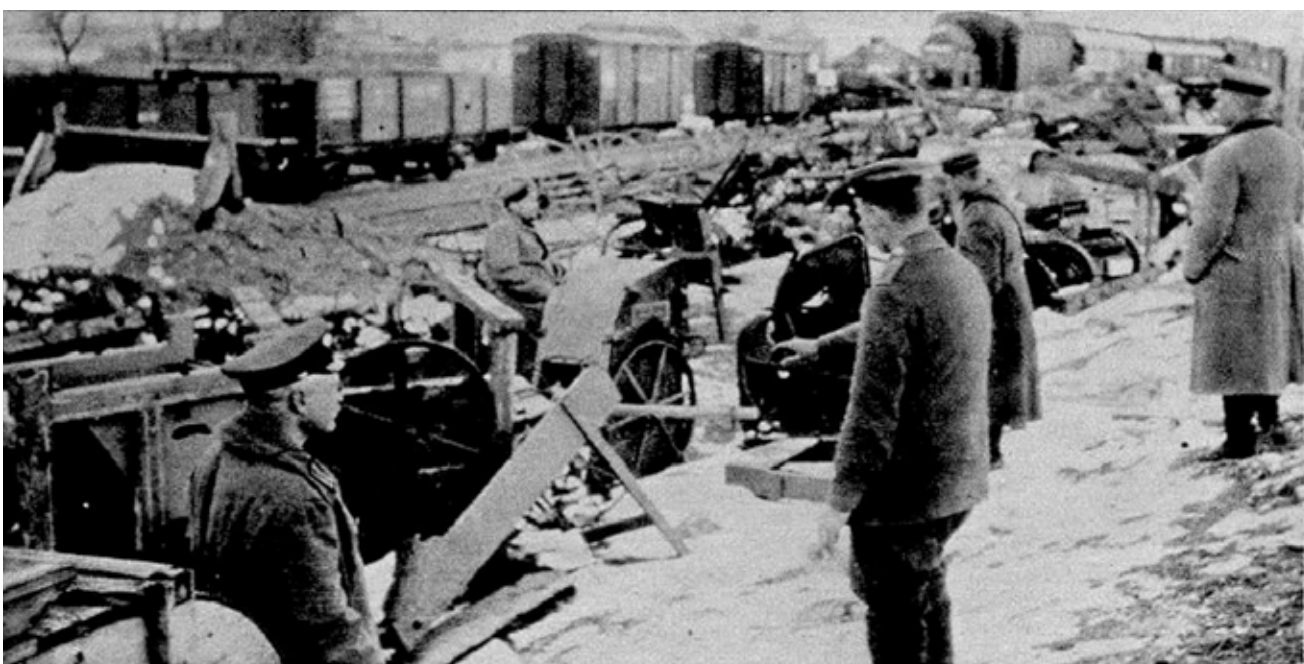
Maszyny rolnicze, których Rosjanie nie zdążyli wywieźć zgromadzone na stacji w Margrabowej (Olecko)

Już 25 czerwca 1915 roku Czygan zdołał wydać w małym formacie Oletzkoer Kreisblatt i przekazać najważniejsze wiadomości.