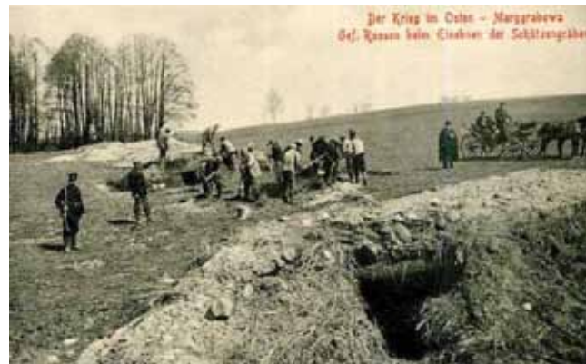
Rosyjscy jeńcy zasypują okopy. Margrabowa, 1915.

Rolnicy natomiast musieli się sami wyżywić. Im przekazywano jedynie zezwolenia na przemiał zboża i paszy. Każdy rolnik nie mógł dokonywać więcej przemiału zboża niż opiewało jego zezwolenie na piśmie. Wysokość określała liczba ludzi do wyżywienia w rodzinie, a w odniesieniu do paszy – ilość koni. Bydło i świnie były pozbawione karmy śrutowej. Do tego obowiązywały obowiązkowe dostawy zboża i mięsa.