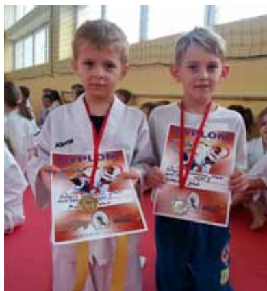
Antek i Kuba zdjęcie obok

Kacper Wróblewski uczeń klasy V z SP 4 - zajął 2 miejsce.