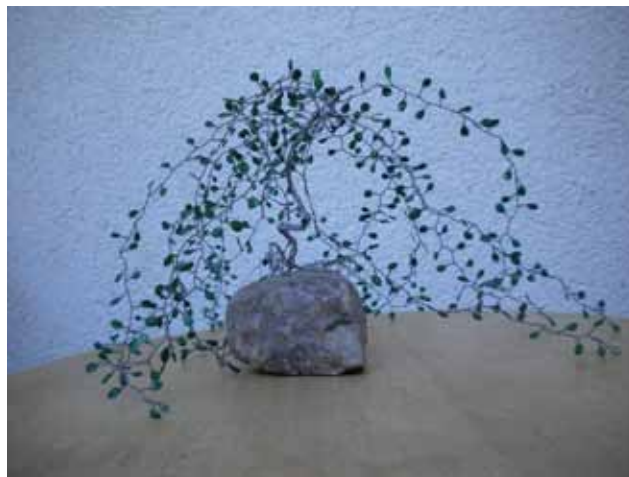
Drzewko szczęścia