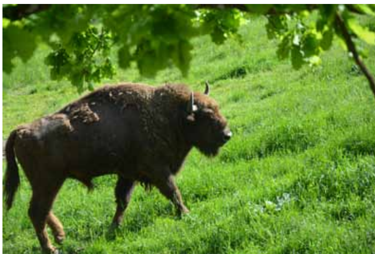
Aleksandra Kalicka (3a) „Zielono mi” III nagroda