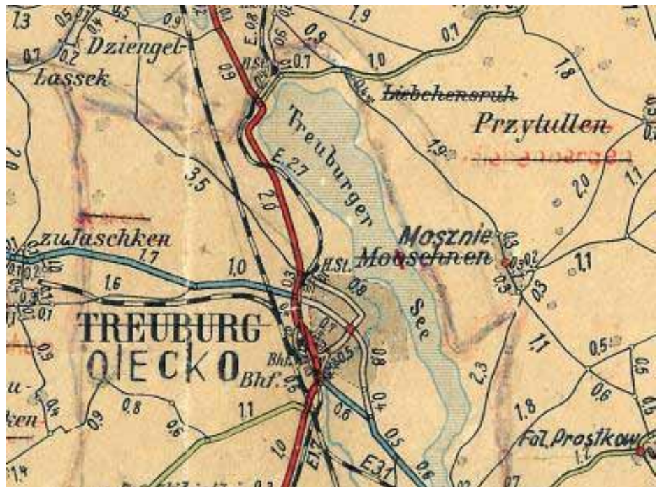
Mapa okolic Teeuburga z naniesionymi po wojnie poprawkami