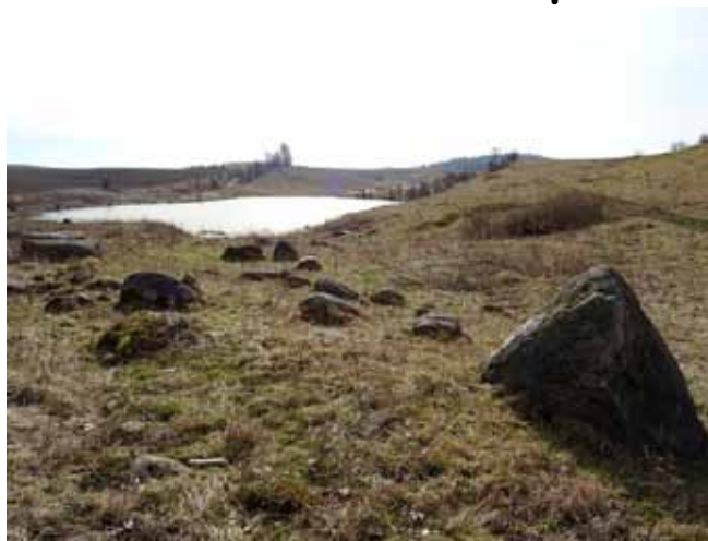
Dojazd: Olecko -Kowale Oleckie - Guzy - Gościrady

Gościradzkie krajobrazy, to urozmaicony polodowcowy teren na południe od Guz.