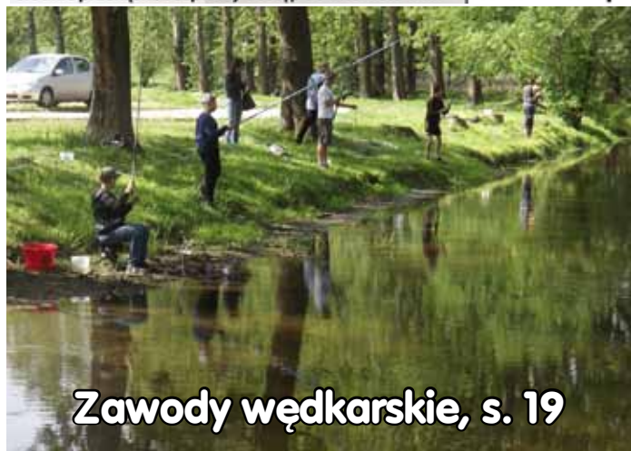
Zawody wędkarskie, s. 19

chleb swojski, ciasta, wypiek, tel. 605-107-755 B37306