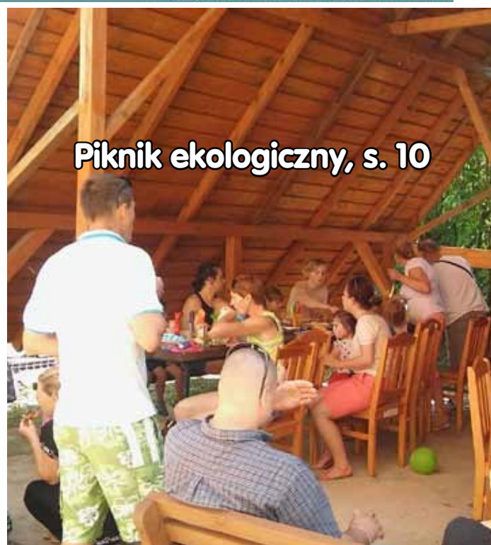
Piknik ekologiczny, s. 10