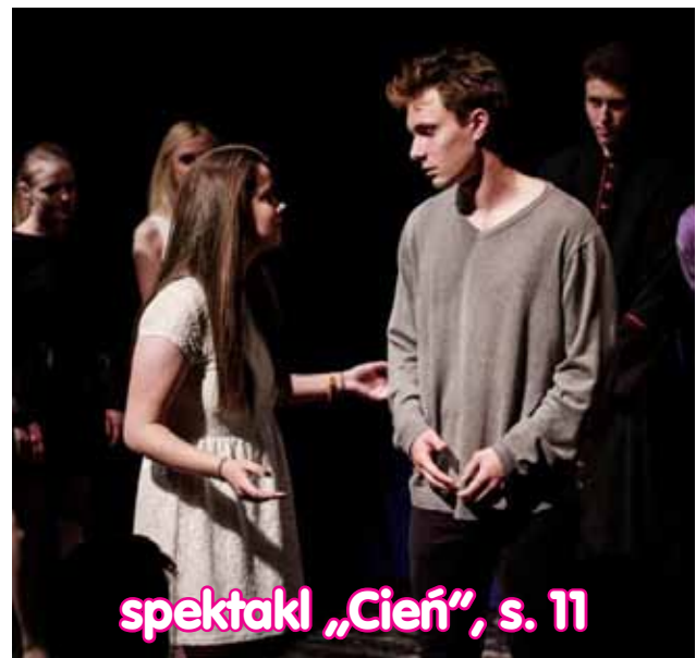
spektakl „Cień”, s. 11