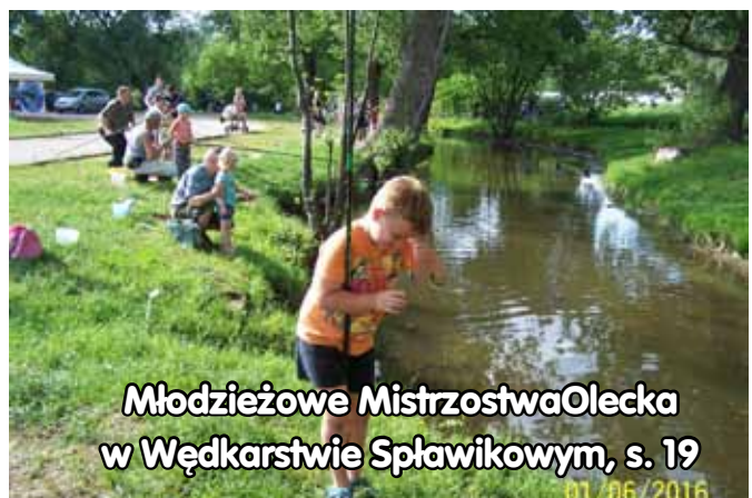
Młodzieżowe Mistrzostwa Olecka w Wędkarstwie Splawikowym, s. 19

30.07 czyli w ostatnią sobotę lipca po raz dwudziesty czwarty pływacy wejdą w toń jeziora Oleckie Wielkie by rywalizować w Oleckim Maratonie Pływackim. Długość trasy wynosi 4,5 km. Każdy ze startujących jest asekurowany z kajaka lub łodzi. Zapisy przyjmuje organizator czyli Miejski Ośrodek Sportu w Olecku. Na zwycięzcę czeka łódź tradycyjnie fundowana przez Delphia Yachts.