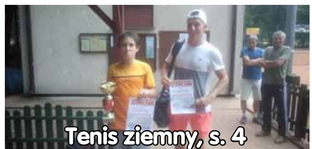
Tenis ziemny, s. 4

chleb swojski, ciasta, wypiek, tel. 605-107-755