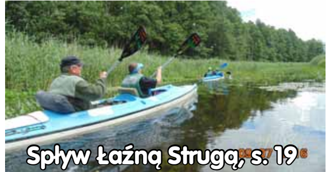
Splyw łażną Strugą, s. 19

Autokary klasy LUX/darmowa kawa/herbata/ słodkie przekąski/bezplatny dostęp do internetu Wifi.