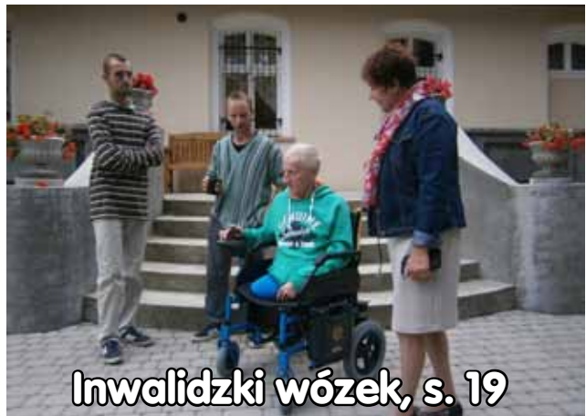
Inwalidzki wózek, s. 19