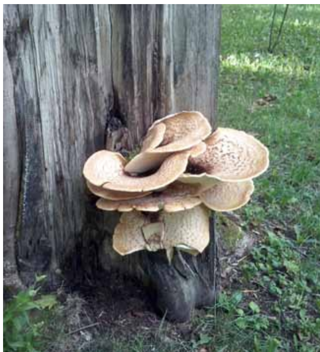
Grzyby rosną wszędzie. Te wyrosły w parku przy stadionie.