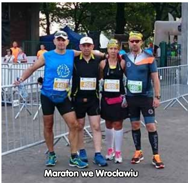
Maraton we Wrocławiu

ły się skurcze oraz problemy żołądkowe. Niemniej jednak pamiętaliśmy, by na każdym punkcie odświeżania nawadniać organizm wodą lub izotonikiem. Tempo biegu zdecydowanie dostosowaliśmy do panujących warunków. Organizatorzy zapewnili odpowiednią, jak na taką temperaturę, ilość punktów odświeżania oraz tzw. kurtyny wodne pozwalające schłodzić organizm.