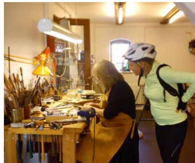
Hasle. Galeria i warsztat. Wyrób srebrnej biżuterii

Docieramy do urokliwego miasteczka Alligne. Słońce pieści. Jest sennie. Jemy drugie śniadanie przed kościołem. Czasami ktoś przemknie sennie. Kobieta w średnim wieku zrywa zeschłe kwiaty w gazonie. Domyśliamy się, że to mieszkanka. Okrążam kościół i odnajduję rzeźbę kobiety – anioła, która przycupnęła na kamieniu. Nieśmiało siadam przy niej i nakazuję uwiecznić te chwile. Zastanawiamy się, za co tubylcy tu żyją. Mija nas samochód z polską rejestracją i od razu puls skacze o kilka kresk.