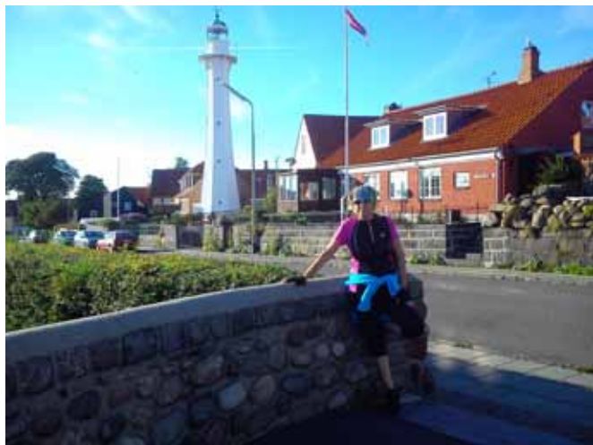
Latarnia morska w Ronne