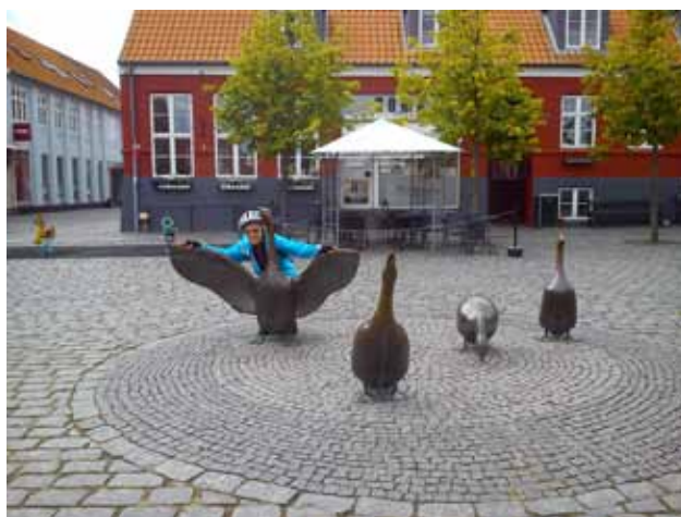
Słynne gęsi w centrum Akirkeby

ton, w którym były reklamówki, które zostawiali ludzie. Można je sobie wziąć, czyli skorzystać z nich, czyli nie nadwyręzać środowiska kolejnym plastikiem.