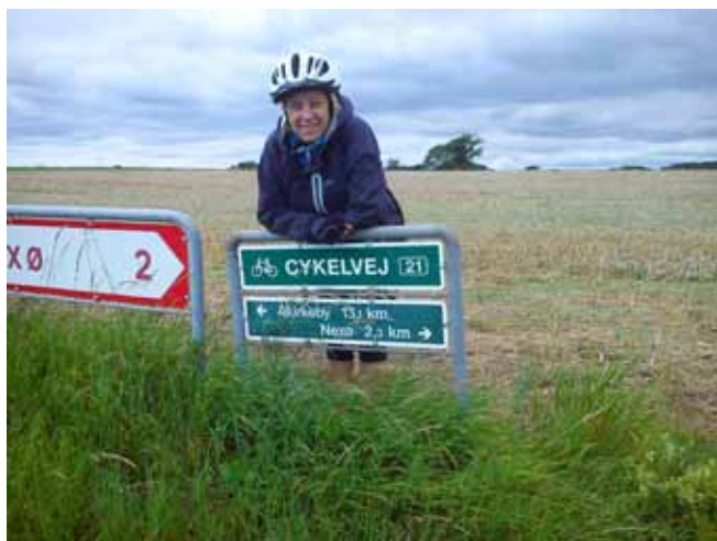
Pierwsza trasa – w drodze do Akirkeby