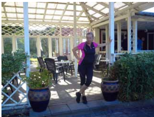
Ronne, taras hotelu

Uliczki Ronne są wąskie, Często są to tzw. kocie łby. Na ulicach pustki o którejkolwiek godzinie i w jaki bądź dzień tygodnia. W końcu samo Ronne liczy sobie 15 tys. mieszkańców, co stanowi niemal 1/3 całej wyspy. Miasteczko sprawia wrażenie wymarłego. Ludzie są. Snują się powoli. Kiedy o 20-tej miał być koncert w kościele, mieliśmy wrażenie, że całe miasteczko idzie obejrzyć i posłuchać ukraińskiego chóru.