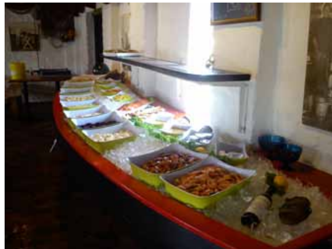
Hasle, „szwedzki stół” za 145 DK

Z daleka widzimy skałę, na której prawdopodobnie w/w Jons nawracał ludzi na chrześcijaństwo. Później przeczytaliśmy w przewodniku, że można było zejść bardzo kamiennym brzegiem nad morze i wejść do jaskiń, ale nie decydujemy się, bo czas nas trochę goni.