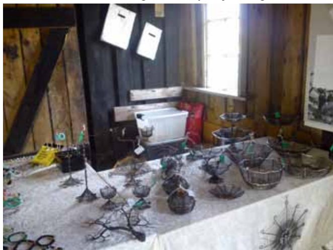
Hasle, pracownia rękodzieła w stodole

Droga do Jons Kapel wije się obok morza. Jest cudownie. Wiem, że się często zatrzymujemy, może nawet za często, ale nie mogę nie wstąpić na dziką plażę. Wyciągamy termos z kawą i obowiązkowo aparat. Żeby dojść do punktu wido-