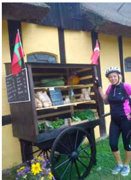
sklepik jakich wiele - bierzesz i wrzucasz pieniądze do skrzyneczki.

.20 km przed punktem docelowym widzimy mnóstwo samochodów. Stadion, czy co? Oczywiście skręcamy. Bilet wejściowy to 25 DK. Wchodzimy, ale okazuje się, że jest już późno (17.00) i kasy zamknięte. Wchodzimy, a tam wyścigi konnych zaprzęgów, kłusaków. Jeden koń, jeden woźnica na takim dziwnym siodełku z rozkraczonymi nogami. Tłumy ludzi. Taki wielki piknik: na kocykach, pod daszkami, na trawie z całymi rodzinami z koszykami. Słońce świeci, zakłady obstawione i nawet niektórzy wygrywają. Widzieliśmy.