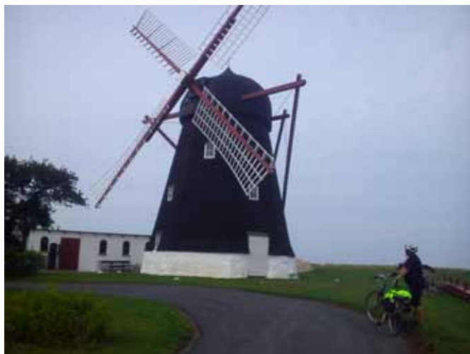
Po drodze ze Svaneke do Ronne

Prom, pociąg, rowery, mieszkanie i w ogóle cała logistyka wydawało się nierealne, a tu, proszę jest. Dzisiaj idę spać, bo jutro znowu trasa.