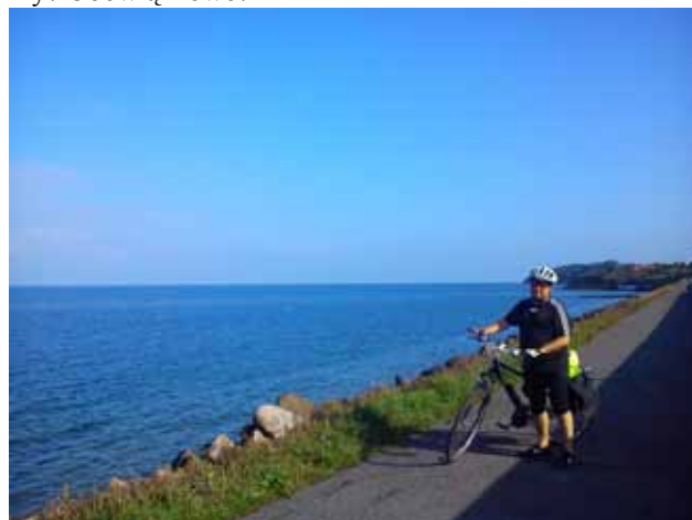
Scieżki w Ronne

Jutro ostatni dzień. I znowu długa trasa. Czy wyruszymy? Obowiązkowo!