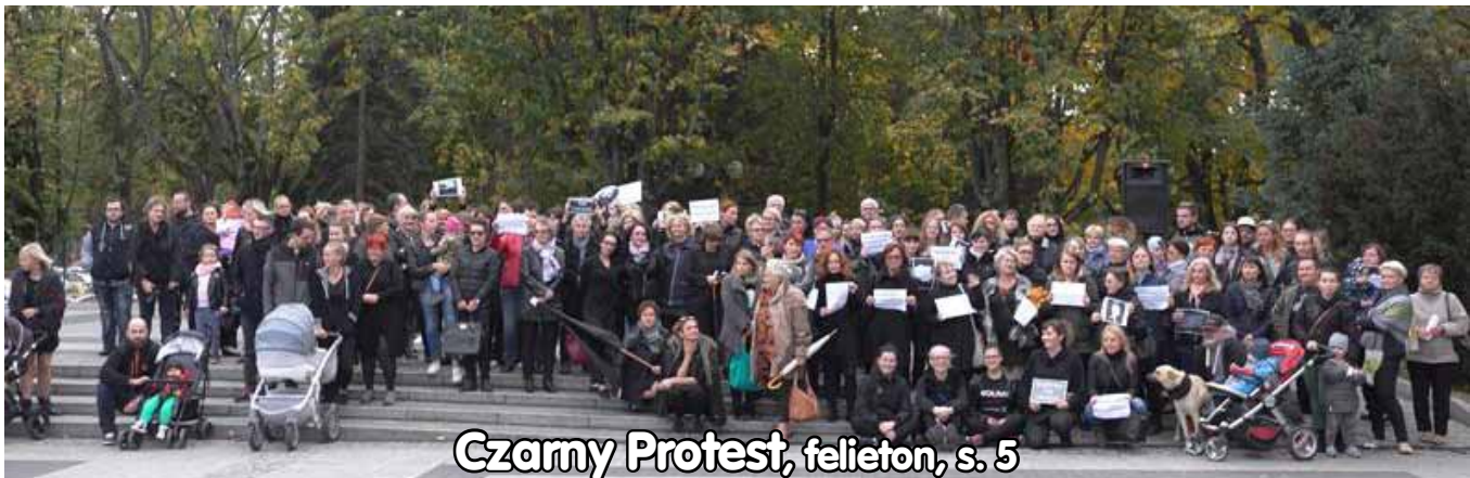
Czarny Protest, felieton, s. 5

„Grünland”, ul. Produkcyjna 11 tel. 87-523-9009 lub 604-557-693