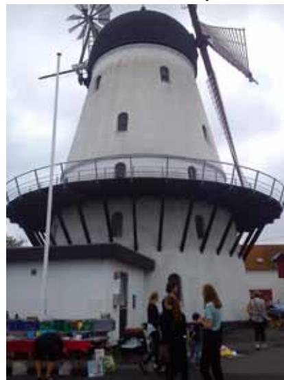
Wiatrak z obrotowym korpusem w Gudhjem