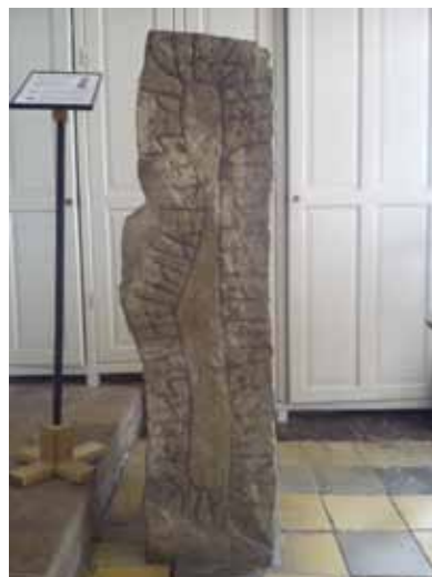
Kamień runiczny z XII wieku (wikingów) w jednym z kościołów

wiatrów, kolorowych domów z oknami bez firanek, kościółków z granitu i różnego krajobrazu – od pól, lasów, nadmorskich klifów po góry. I ludzi, którzy nigdzie się nie spieszą. Wszystko tu jak w reklamie. I wszystko tu jest akurat i takie przemyślane. Nawet w tym hostelu. Przesuwam się na krzesła tak, by słońce miało możliwość pieścić moją duszę.