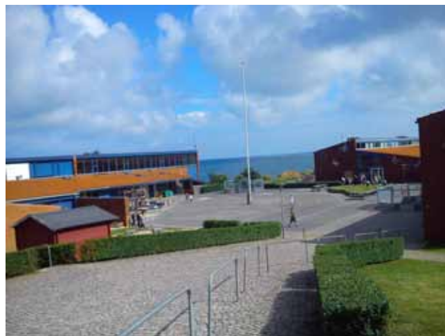
Szkoła w Allinge

Allinge – Sandvig i na Hammer Odde – najdalej na północ wysunięty punkt wyspy. Allinge to nadmorskie miasteczko. Jesteśmy tu po raz drugi, by dokładniej je spenetrować. Za chwilę wejść na skałę i poproszę o foto.