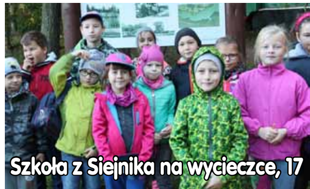
Szkoła z Siejnika na wycieczce, 17