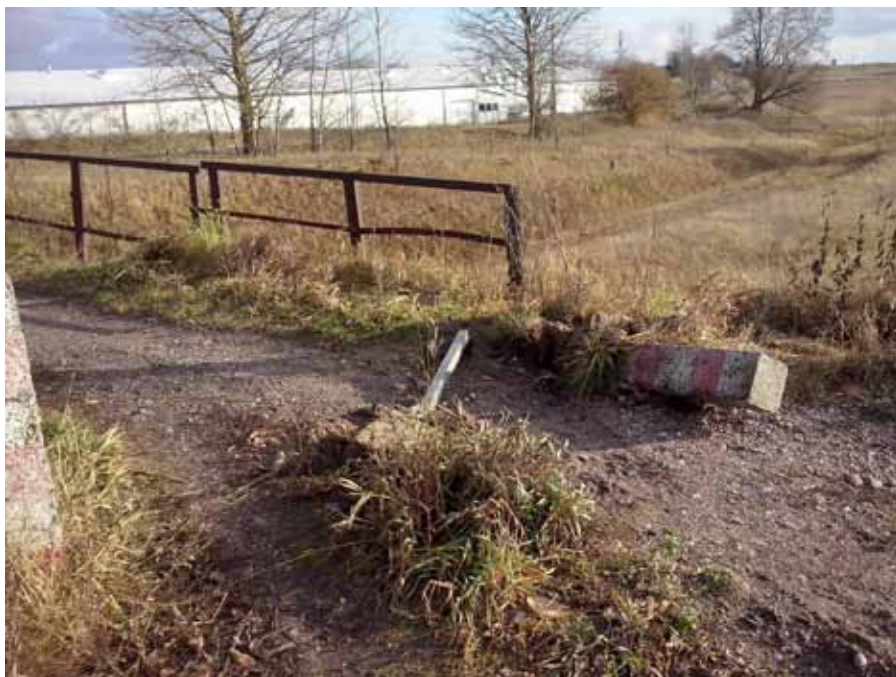
Tak wygląda wiadukt nieczynnej kolei na trasie Olecka - Gołdap