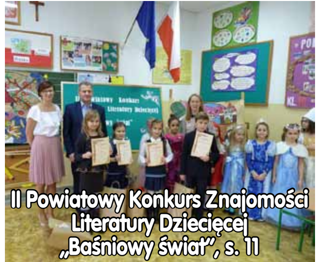
II Powiatowy Konkurs Znajomości Literatury Dziecięcej „Baśniowy świat”, s. 11