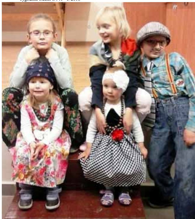
Najmłodsze dzieciaki świetliczaki