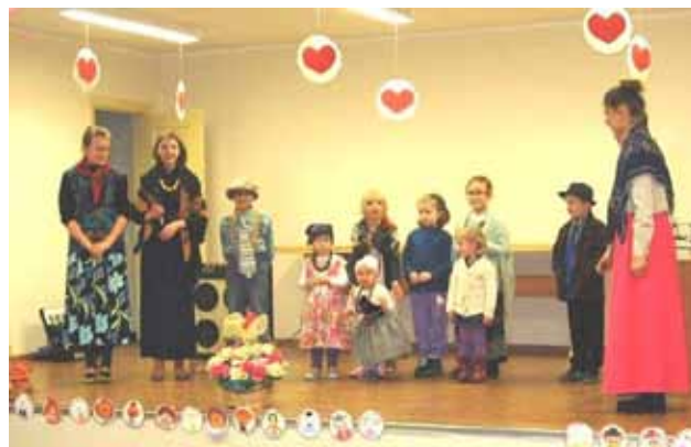
Przedstawienie dla babci i dziadka

W Tłusty Czwartek upiekliśmy tradycyjne pączki i zorganizowaliśmy dzieciom karnawałową zabawę przebierańców. Na finał zajęć było ognisko z kiełbaskami.