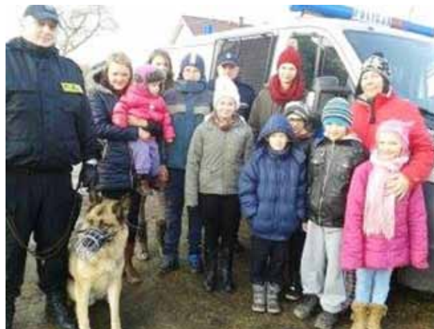
Spotkanie z policjantami

Dzięki wspólnym działaniom rodziców i sołtysa udało się przygotować opał do świetlicowego kominka, zorganizować poczęstunek dla babć i dziadków oraz nagrody konkursowe dla dzieci.