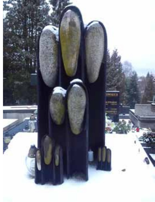
Anioły na grobie Nikifora

Po drodze znalazłam kapliczkę na drzewie opatuloną z folię, pewnie od śnieżyc. Wzruszający widok.