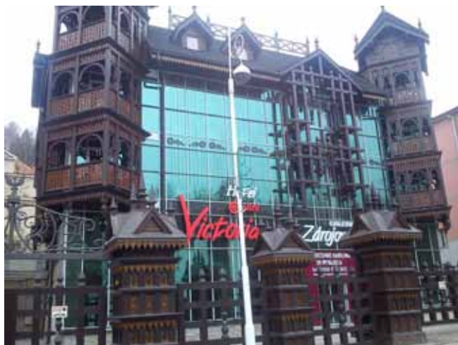
Takie „plomby” są w centrum Krynicy

Po kilkuset metrach zawahałam się: weszłam na szlak na końcu Krynicy, idę w przeciwną stronę i znowu mam wyjść w Krynicy? Nie, coś tu nie gra. Jeszcze znajomy, który akurat zadzwonił zaczął żartować sobie, że jak spotkam takiego wielkiego w brązowym futrze... Wyłączyłam się, bo autentycznie przeszedł mnie dreszcz. Dobrze, że za kilka minut dobiegł do moich uszu gwar samochodów, więc wiedziałam, że jestem blisko drogi.