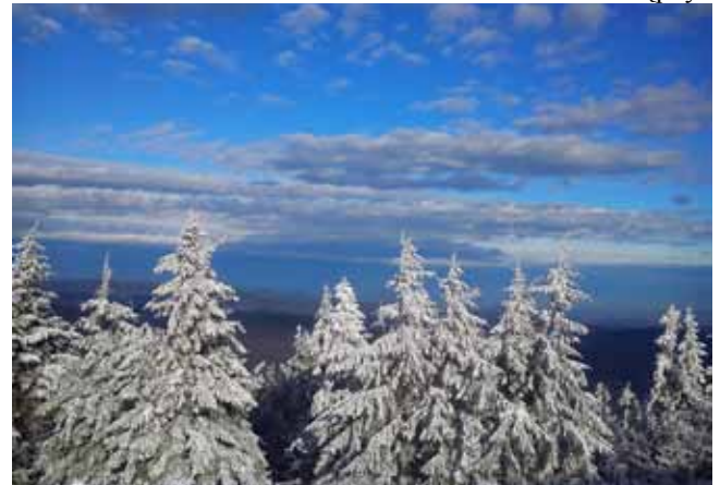
Grudniowy widok z Jaworzyny