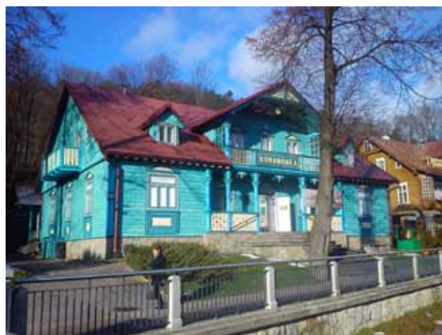
Willa Romanówka, obecnie muzeum Nikifora

I poszłam, ale nie było ani szczytu, ani żółtego szlaku, więc rezolutnie trzymając się wyciągu na Słotwiny – zeszłam.