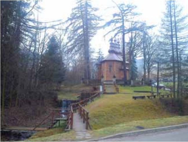
Kościółek na Słotwinach (dzielnica Krynicy), dawniej cerkiew