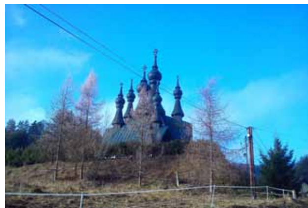
Cerkiew bł. Włodzimierza w Krynicy

Nie udało się czwartego szczytu zaliczyć, ale nie daruję! Idę jutro, tylko mnie koleżanka straszy tymi niedźwiedziami, co to w sen zimowy za mocno nie zapadły. I trochę się tym przejęłam. Jutro się przekonam co zwyciężyło: domniemane niedźwiedzie czy Jaworzynka? A jak dobrze pójdzie, to jeszcze Hawryłówkę zaliczę (780 m n.p.m.) A co!