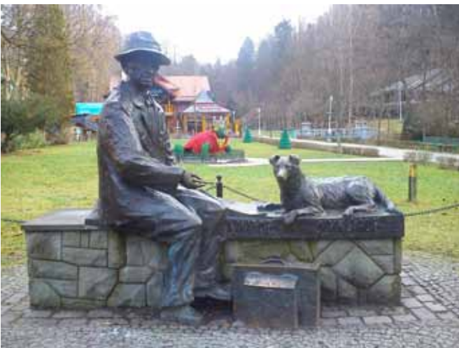
Nikifor jak malowany (wyrzeźbiony) w centrum

Wylądowałam 4 km od miasta. Nie dziwię się, że nikt nie chciał się zatrzymać widząc samotnie spacerującą poboczem istotę z opaską na głowie, odblaskiem na ręce i rozwianą czupryną. Zaliczyłam, ale włączył się rozsądek i zmęczenie lekko daje znać.