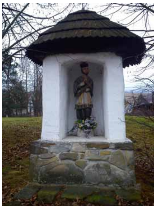
Świątek odnaleziony na trasie

Zajęta rozmową nie zauważyłabym takiej atrakcji. Odwróciłam głowę, żeby przejść na drugą stronę jezdni i... jest kopiec! A na nim wysoki cokół, na którym siedzi orzeł i coś