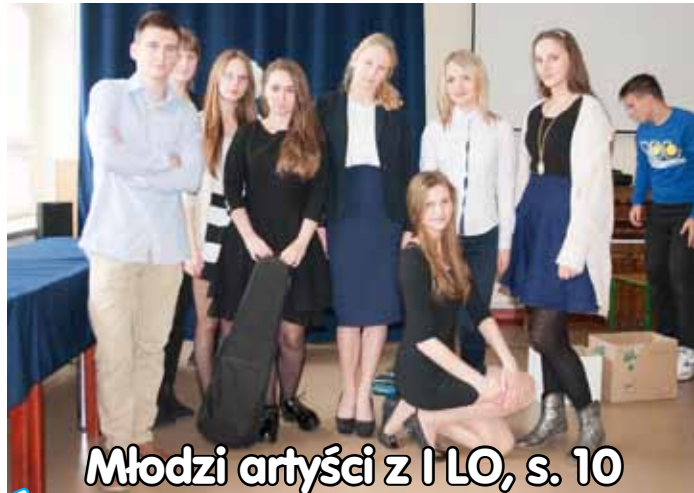
Młodzi artyści z I LO, s. 10