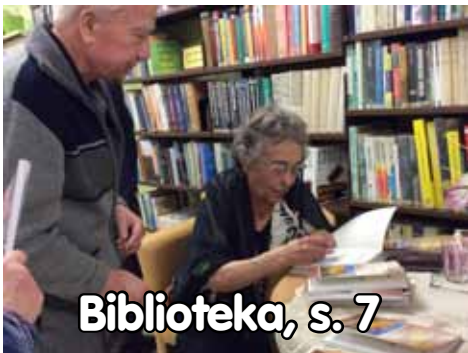
Biblioteka, s. 7

Firma „IBATUR” postanowiła uczcić tysięczne wydanie „Tygodnika Oleckiego” uczcić ufundowaniem czterech biletów na weekendowy wyjazd luksusowymi autobusami tej linii pasażerskiej do Brukseli. Szczegóły na s. 4