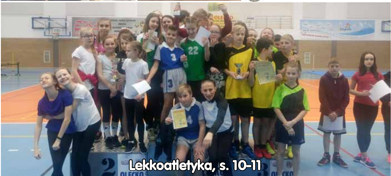
Lekkoatletyka, s. 10-11