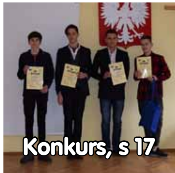
Konkurs, s 17