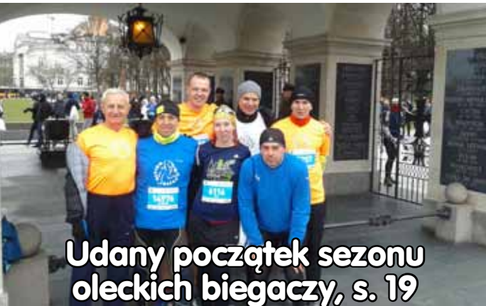
Udany początek sezonu oleckich biegaczy, s. 19

biuro: (85) 7 404 404 infolinia: 795 404 404 www.ibatur.pl