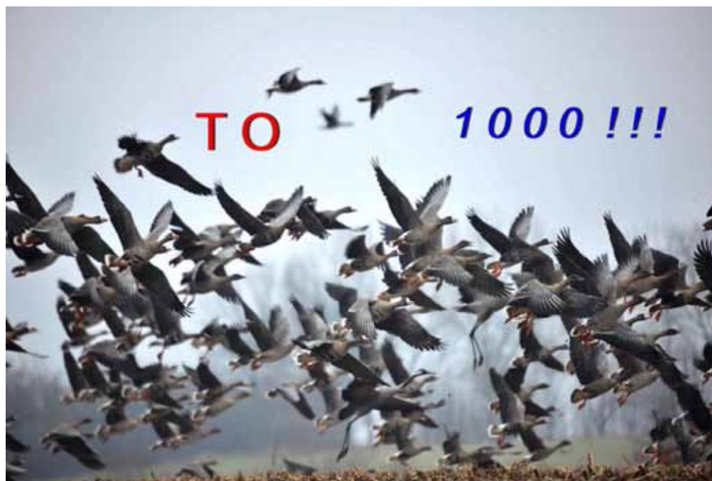
Wysokich lotów i ostrego pióra