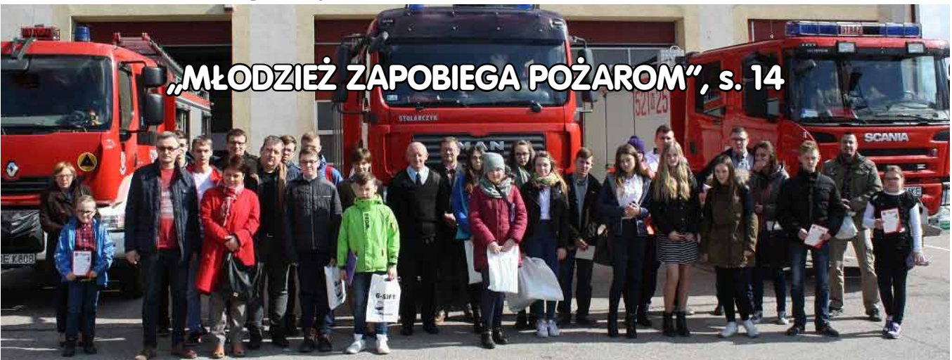
„MŁODZIEŻ ZAPOBIEGA POŻAROM”, s. 14

Poeci Pogranicza Warmii, Ma- zur i Suwalszczyzny, s. 10-11