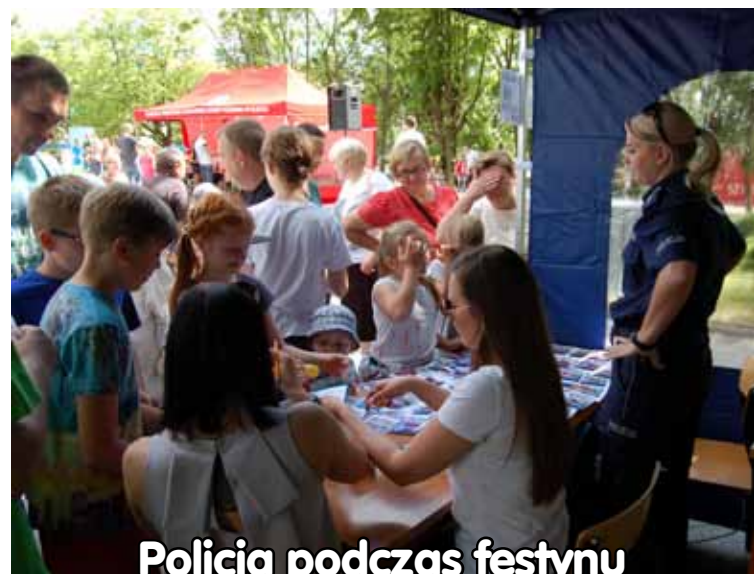
Policja podczas festynu „Bezpieczny Powiat”, s. 4

chleb swojski, ciasta, wypiek , tel. 605-107-755 L00605