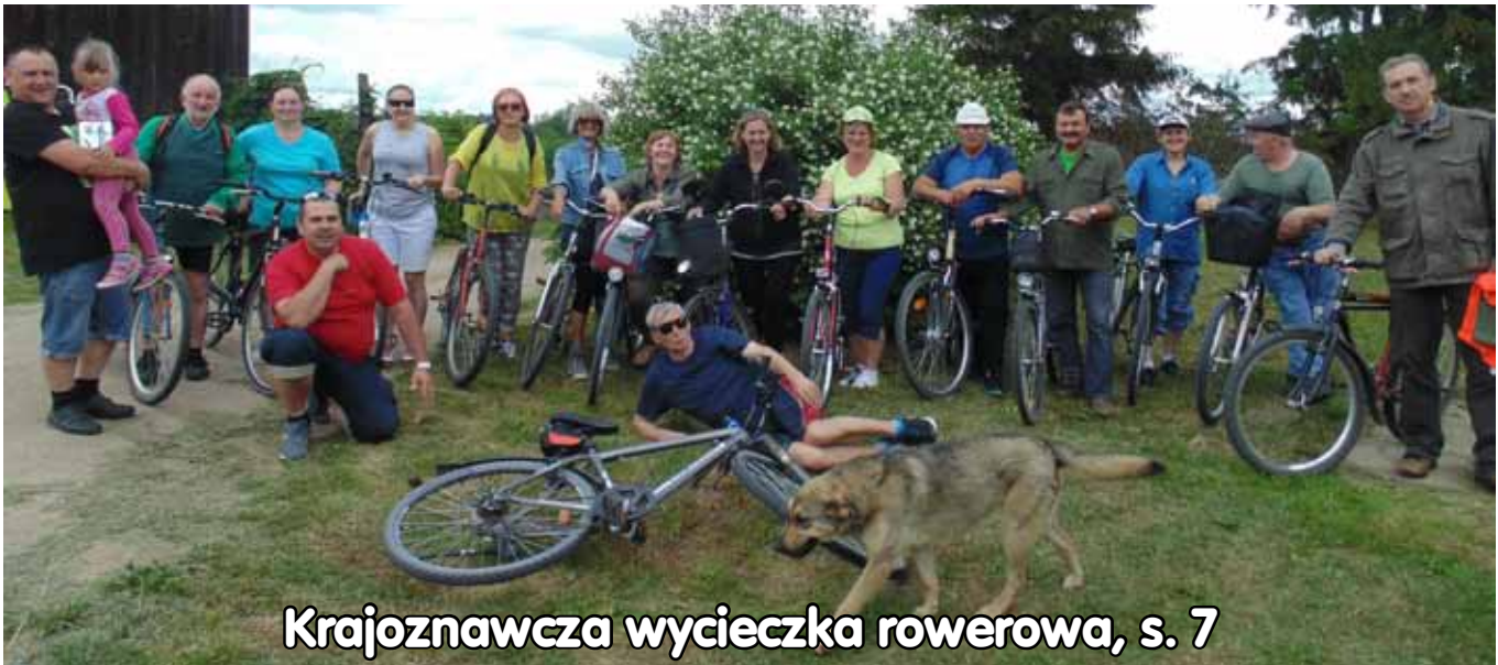
Krajoznawcza wycieczka rowerowa, s. 7