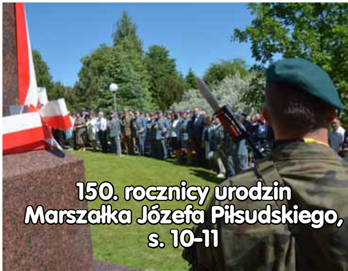
150. rocznicy urodzin Marszałka Józefa Piłsudskiego, s. 10-11