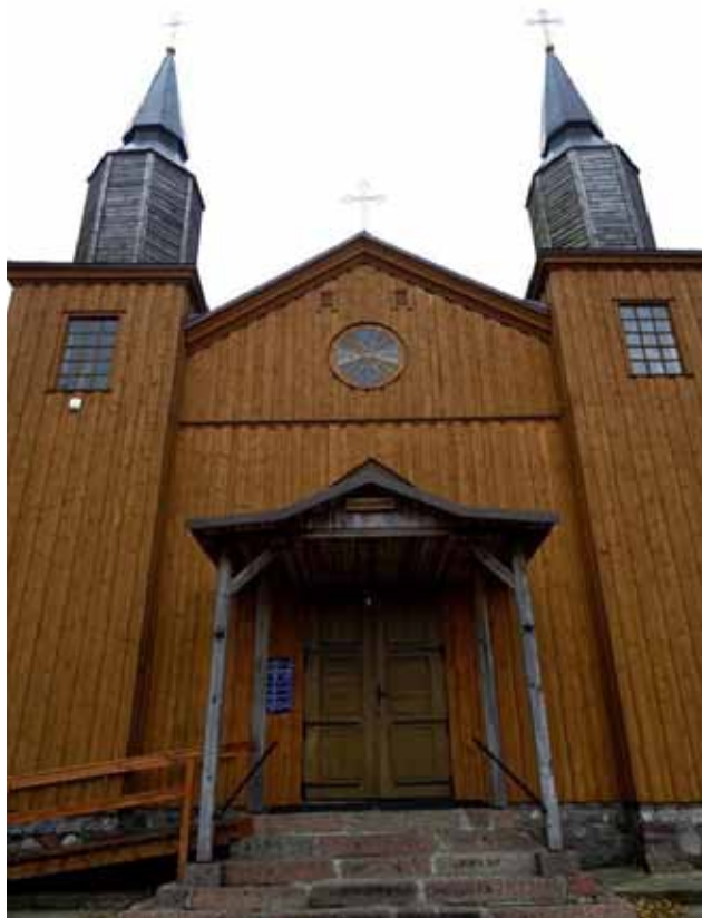
Trasa: Olecko - Szurpily - Jeleniewo

Jeleniewo (powiat suwalski). W zabytkowym drewnianym kościele pw. Najświętszego Serca Pana Jezusa – obecny kształt z 1878 r., remont w 2015 r. znajdują się stacje drogi krzyżowej z XIX w., konfesjonał i ambona z konfesjonałem z 1846 r.