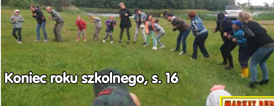
Koniec roku szkolnego, s. 16