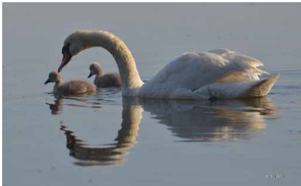
Na oleckim jeziorze