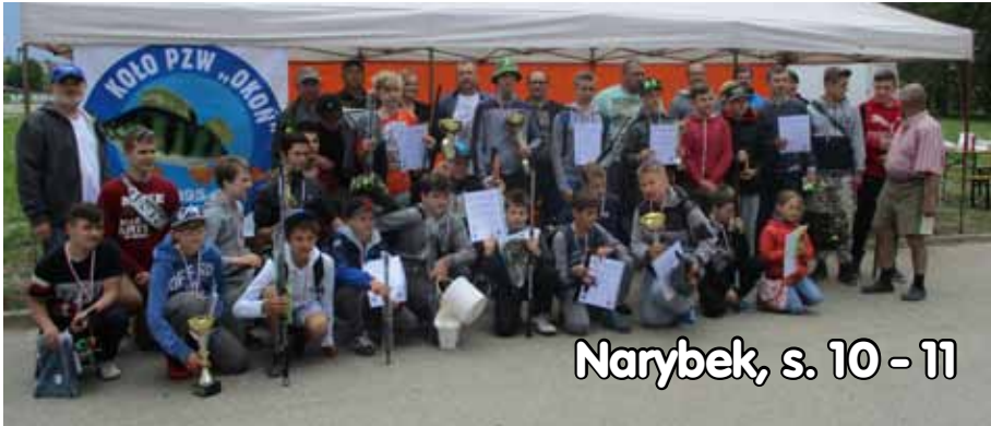
Narybek, s. 10 - 11