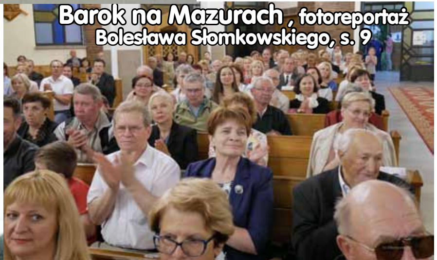
Barok na Mazurach, fotoreportaż Bolesława Słomkowskiego, s. 9