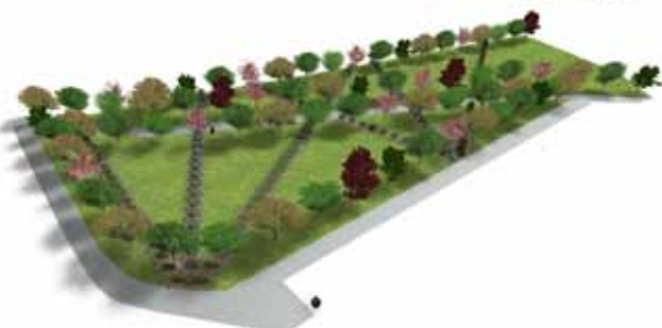
Wizualizacja nr 1