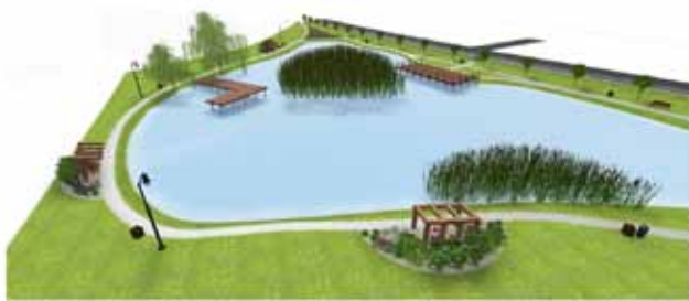
Wizualizacje terenu przy stawie