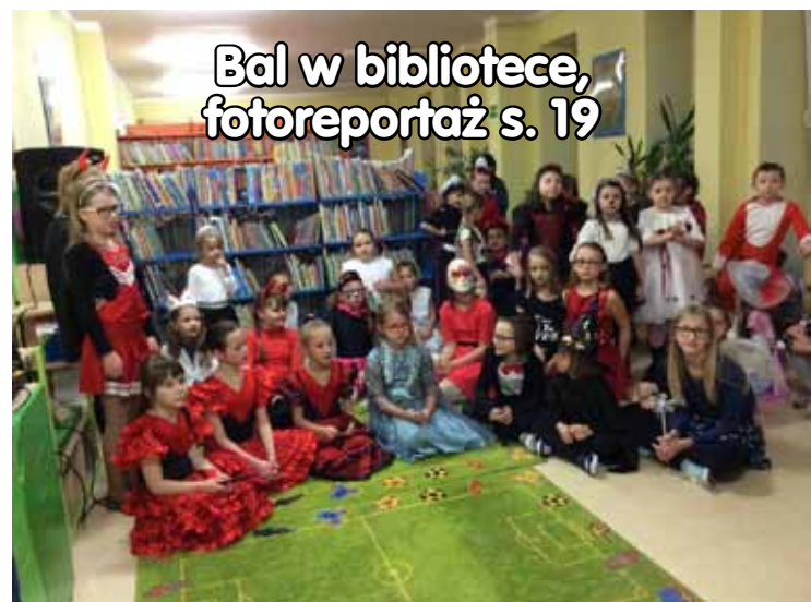
Bal w bibliotece, fotoreportaż s. 19

Plac Wolności 22, II piętro, budynek Regionalnego Ośrodka Kultury