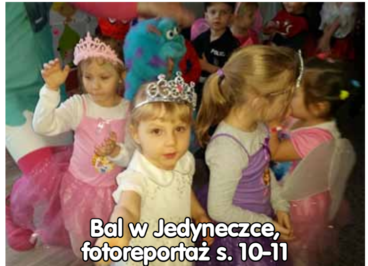
Bal w Jedyneczce, fotoreportaż s. 10-11

Regionalny Ośrodek Kultury w Olecku „Mazury Garbate”