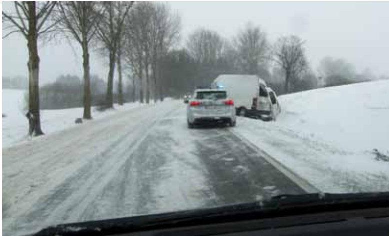
Uwaga, ślisko na drogach.

Zespół Szkół w Olecku i sekcja szachowa MLKS Czarni Olecko zapraszają uczniów szkół podstawowych oraz gimnazjów do wzięcia udziału w