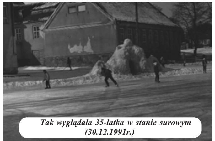
Tak wyglądała 35-latka w stanie surowym (30.12.1991r.)