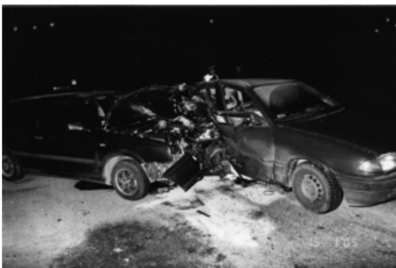
Przyczyna: Niezachowanie należytej odległości.