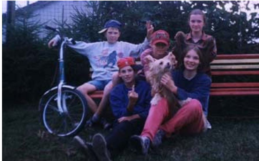
Wesoła paczka w przerwie między szaleństwami.