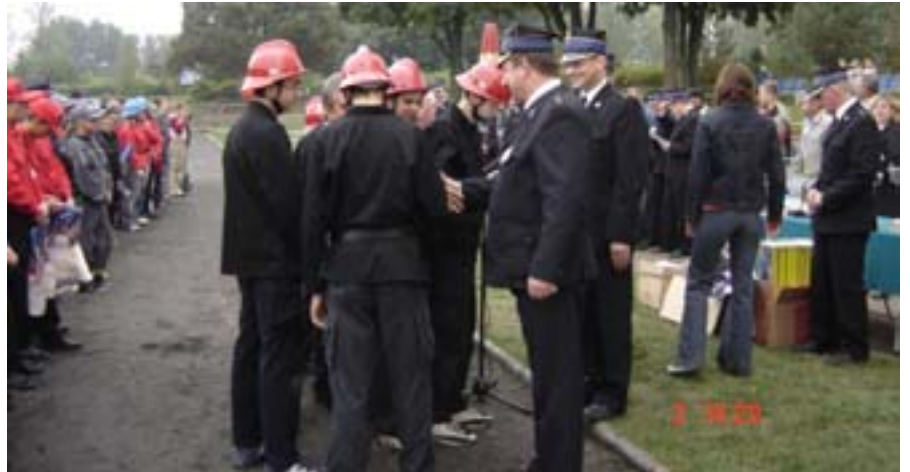
1. miejsce chłopców MDP z