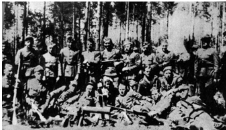
Partyzanci IV Uderzeniowego Batalionu Kadrowego AK, operujący w czerwcu 1943 r. na Białostocczyźnie.

W dniu 8 lipca 1945 roku patrol partyzancki z oddziału „Romana” rozbroił leśniczego niemieckiego z Płaskiej, zabierając od niego 2 karabiny, 2 dubeltówki, 4 sztuki broni krótkiej, amunicję i aparat radiowy.