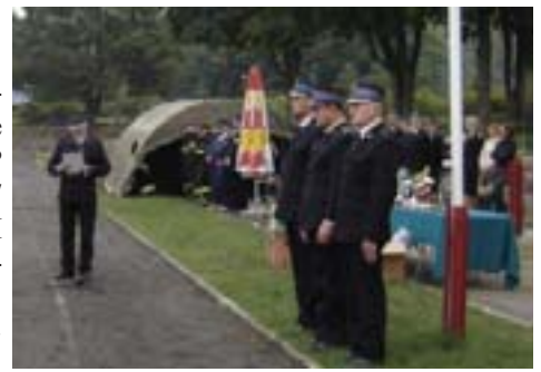
Otwarcie zawodów przez Komendanta Powiatowego PSP w Olecku.

Dziękujemy sponsorom i fundatorom nagród i pucharów.