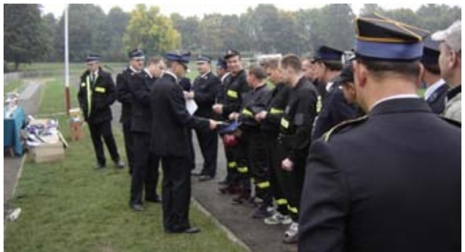
Losowanie kolejności startów.