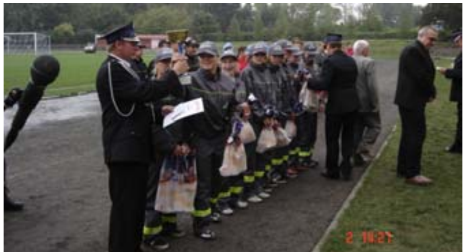
1. miejsce dziewcząt MDP z Lenart.