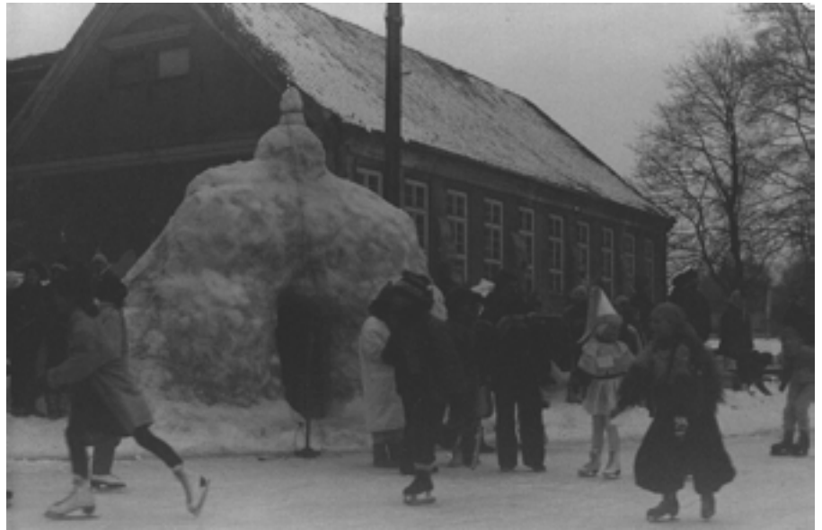
35-latka podtopiona podczas odwilży.

Najwięcej jeżdżących notujemy w dniu 21 lutego. W piątek, po poro-