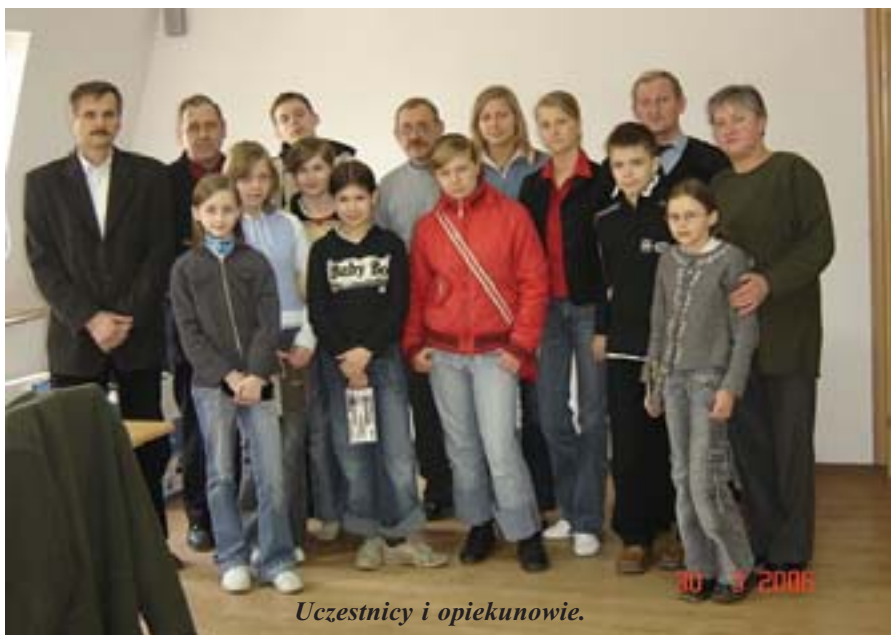
Uczestnicy i opiekunowie.