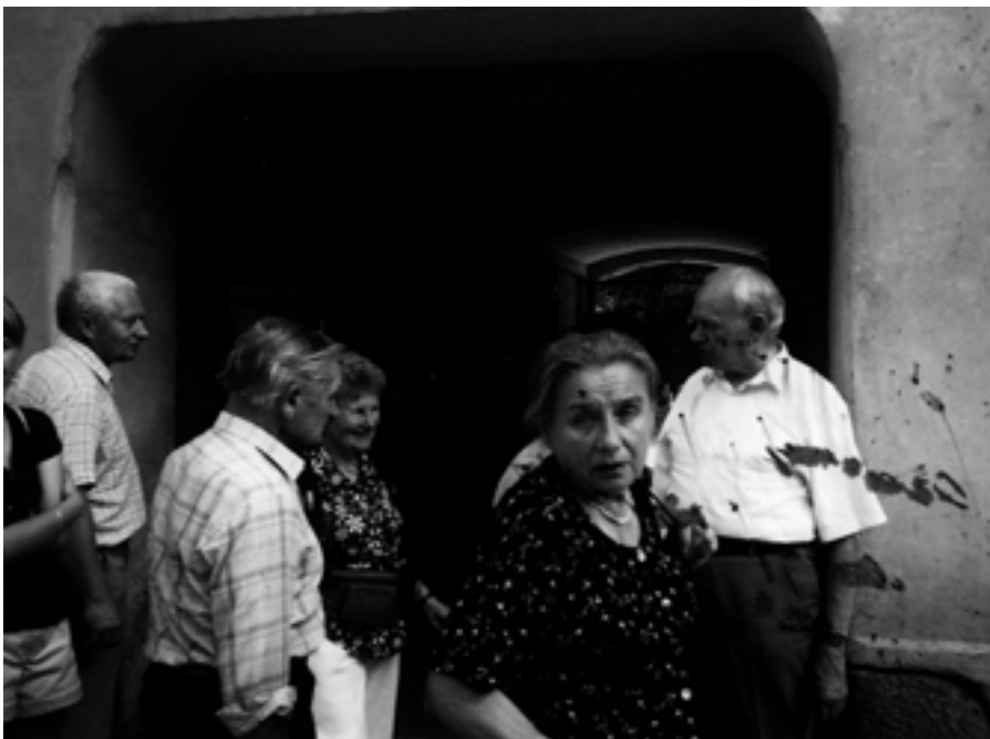
Na ul. Zawalnej.

Na dworzec w Wilnie przybyliśmy o godz. 8.00 i pierwszą czynnością, jakiej dokonaliśmy, była wymiana pieniędzy polskich na litewskie lity. Za każde 100 zł otrzymaliśmy 92 lity, bo lit był droższy od złotówki. Po wymianie pieniędzy pojechaliśmy do największej szkoły polskiej w Wilnie, wybudowanej po wojnie, w której naukę pobierało 2000 dzieci i młodzieży z Wilna i okolic. Posiliwszy się śniadaniem udaliśmy się na ulicę Dominikańską, gdzie w polskim kościele p.w. Św. Ducha miało odbyć się nabożeństwo celem uczczenia rocznicy Wojska Polskiego, przypadającej 15 sierpnia. Po wejściu do kościoła stwierdziłem, że wszystkie miejsca są zajęte, tudzież po parominutowym staniu pod ścianą, wyszedłem na ulicę Dominikańską i udałem się w kierunku ul. Niemieckiej, w restauracji zamówiłem lody i zacząłem je konsumować pod baldachimem, obserwując ruch uliczny, nie mogąc poznać znanej mi z roku 1935 ulicy. Część budynków została zniszczona podczas wojny i później odbudowana przez Litwinów. Po skonsumowaniu lodów udałem się na ul. Dominikańską do kościoła, z którego ludzie wyruszali na cmentarz Rossa. Nasza grupa, złożona tylko z trzech Trzynastaków i sympatyczek harcerek z Radomska oraz trzech wrocławianek również tam się udała. C.d.n.