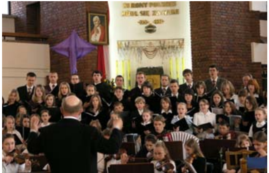
I rocznica śmierci Jana Pawła II, Olecko, 2 kwietnia 2006r., kościół pod wezwaniem NMP Królowej Polski.

Jeżeli zapotrzebowanie na nowym kierunku będzie duże WM planuje studia magisterskie.