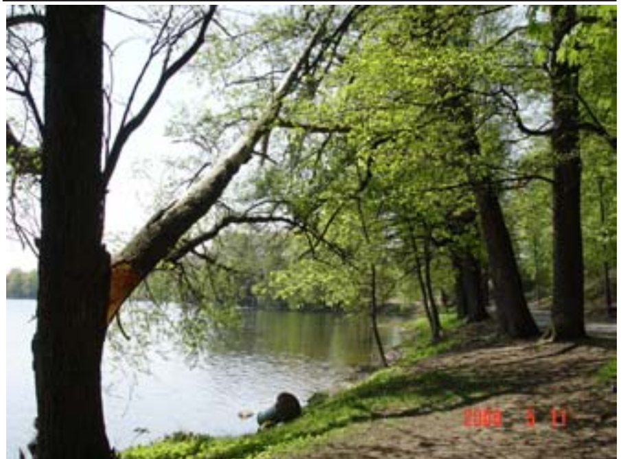
Jest sporo takich suchych drzew w okolicy „Skoczni”. Widoczne na zdjęciu pękło podczas silnego wiatru we wtorek (9 maja) i zagraża przechodniom.