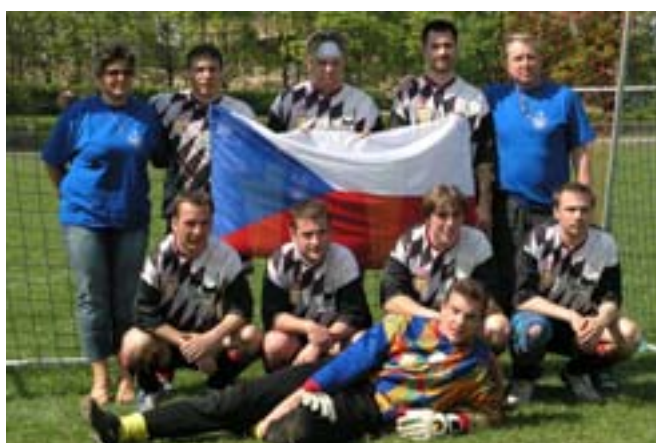
II Miejsce – reprezentacja policji Czech