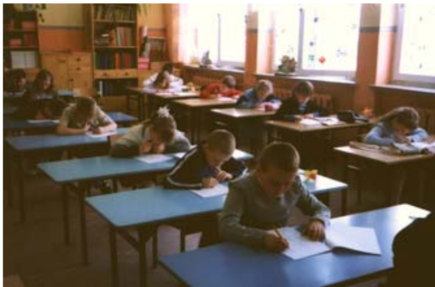
To my – uczestnicy i opiekunowie II Powiatowego Konkursu Ortograficznego klas II „Mistrz Ortografii” w Szkole Podstawowej nr 1 w Olecku.