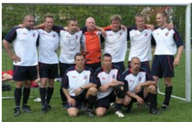
IV miejsce - reprezentację antyterrorystów z Warszawy.