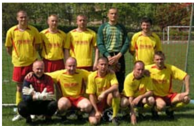
I miejsce - reprezentacja Straży Miejskiej z Warszawy.