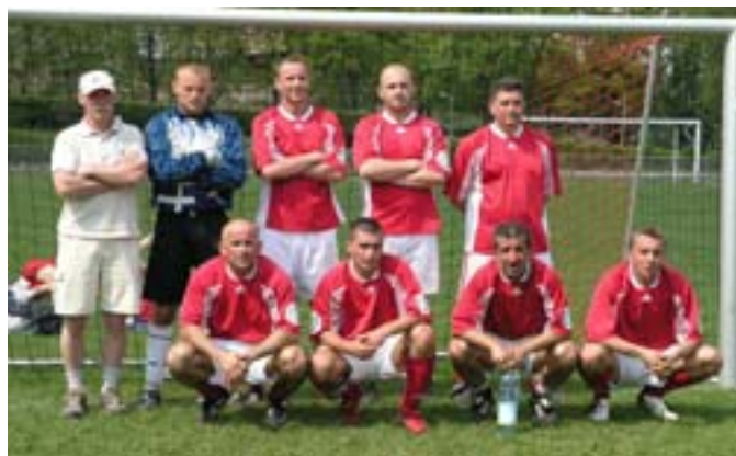
III miejsce - reprezentacja Szkoły Policji ze Szczytna.