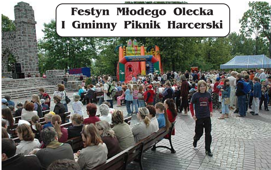
Fotoreportaż autorstwa Józefa Kunickiego - w następnym numerze.