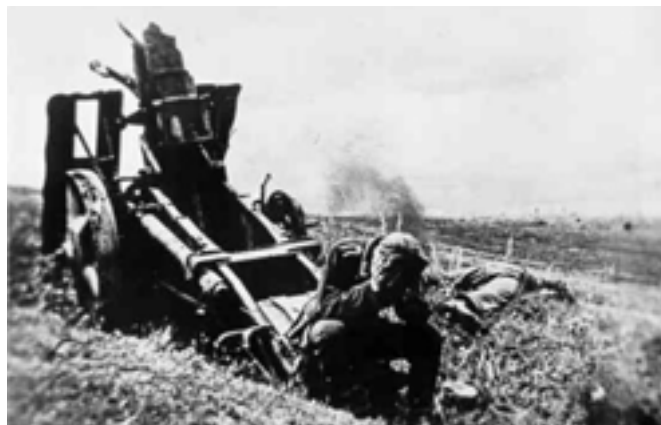
Po bitwie. Zniszczone działo niemieckie.

wódz widzi sytuację jasno (sam już nieraz był w takiej sytuacji): dwa potężne kliny gotowe do zmiżdżenia dwóch frontów. Jeśli przeciwdzierzenie trafi w pustkę – to Niemcy zaatakują i dwa fronty będą stracone. Informacje o potencjalnym ataku Niemców mogły być błędne. To przecież jasne. Sam Żukow już nieraz znalazł się w takiej sytuacji. Więc co robi wielki marszałek? Stwierdza, że nie musi być za to odpowiedzialny i wieje! Wieje na najspokojniejszy odcinek frontu: Front Zachodni, gdzie dowodzi jego następca Sokołowski. Jakie ważne działania przeprowadził tam Żukow – tego historia Wielkiej Wojny Ojczyźnianej nie mówi. Sam Żukow ominął ten etap w swojej bio- i autobiografii. Jedno co wiemy, to to, że w tym czasie nie było żadnych poważnych działań na tym odcinku frontu. Nie było żadnej bitwy czy potyczki.