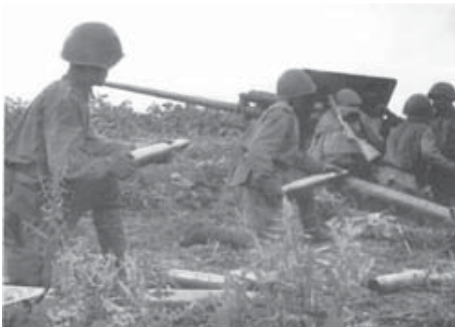
Radziecka artyleria przeciwpancerna.

i kontrataku Żukow ani razu nie pojawił się ani na spotkaniach w sztabach, ani na froncie. W przeddzień walk pojawił się i nawet nie zapoznając się dokładnie z sytuacją przekazał całą odpowiedzialność w ręce Rokossowskiego. Nie przeszkodziło mu to po wojnie napisać wspomnień, w których opisał „swoją myśl batalii o Kursk”. Cały „fakt” przedstawiono też w filmie „Wyzwolenie”, gdzie w scenie o Kursku to Żukow wydaje rozkaz o działaniach wojennych. Była to nieprawda, która została skrytykowana przez wielu radzieckich dowódców czasu wojny. Krytyka była bardzo głośna nawet w samym Związku Radzieckim. Ale działo się to w czasach innego geniusza wojskowego Leonida Breżniewa i kult Żukowa – błagiera mógł uzasadnić istnienie innego „geniusza” wojny.