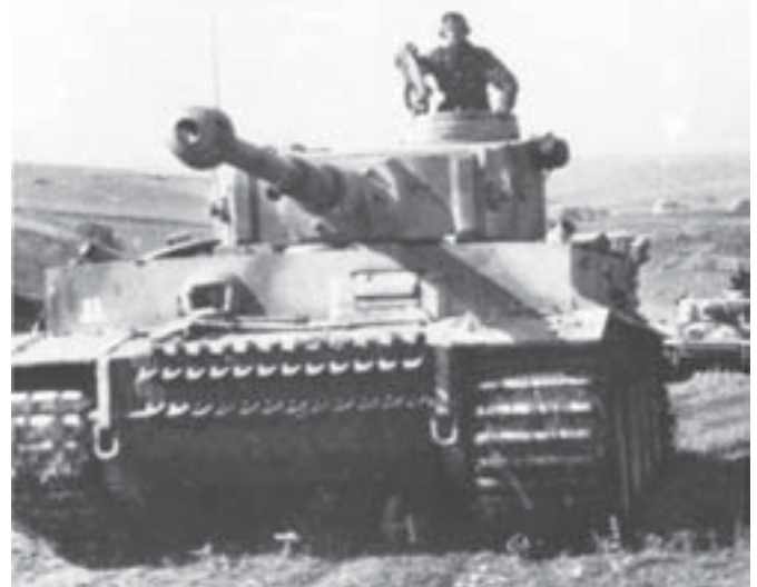
Niemiecki czołg ciężki Tygrys.

kiego dowództwa. Pomocą przyszła też pomoc brytyjskiej Ultry (ośrodka wywiadu wojskowego zajmującego się rozszyfrowaniem niemieckiej Enigmy – to inna i ciekawa historia). Ustalono dzięki tym informacjom optymalną, możliwą datę niemieckiego ataku. Wszystko to odbyło się poza zasięgiem wiedzy Żukowa. Dowodzący frontami: Centralnym i Woroneskim generałowie armii Rokossowski i Watutin otrzymali od Stalina (via Sztab Generalny kierowany przez Wasilewskiego) informacje o możliwym ataku. Obaj dowódcy frontów doskonale skorzystali z informacji i przystąpili do operacji powstrzymania niemieckiego ataku. Przygotowywano linie obronne, pola minowe, prowadzono prace inżynierskie itd. Od schwytanych w dniach 3-5 lipca jeńców dowiedziano się o terminie ataku. Jeńcy zeznali, że atak nastąpi 5 lipca o godzinie 3 nad ranem.