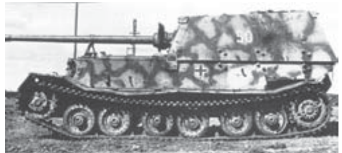
Niemieckie samobieżne działo pancerne Ferdinand. Poniosły klęskę pod Kurskiem.

5 lipca przed 3 rano (o godzinie 2.20) to nie Niemcy otworzyli pierwszy ogień. Nawałnicę artyleryjską rozpoczęły wojska obu frontów. Żukow już w przededniu bitwy zrezygnował z odpowiedzialności za działania wojskowe. Całą odpowiedzialność za operację przekazał Konstantemu Rokossowskiemu.