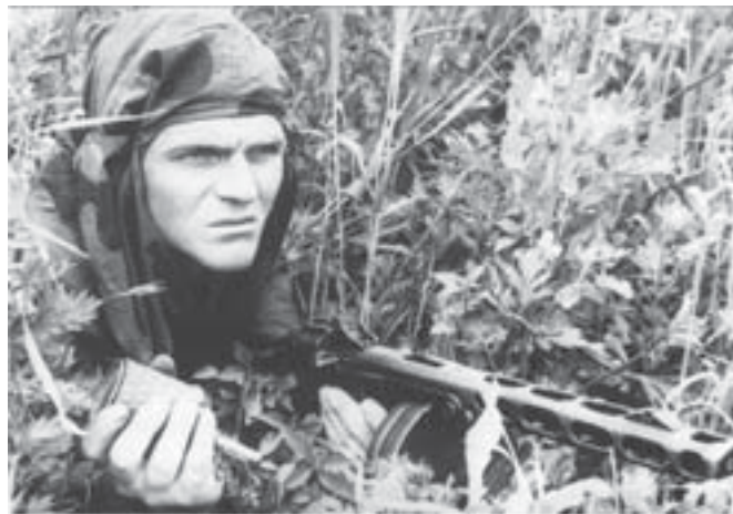
Radziecki zwiadowca - spadochroniarz pod Kurskiem.

wódz widzi sytuację jasno (sam już nieraz był w takiej sytuacji): dwa potężne kliny gotowe do zmiżdżenia dwóch frontów. Jeśli przeciwdzierzenie trafi w pustkę – to Niemcy zaatakują i dwa fronty będą stracone. Informacje o potencjalnym ataku Niemców mogły być błędne. To przecież jasne. Sam Żukow już nieraz znalazł się w takiej sytuacji. Więc co robi wielki marszałek? Stwierdza, że nie musi być za to odpowiedzialny i wieje! Wieje na najspokojniejszy odcinek frontu: Front Zachodni, gdzie dowodzi jego następca Sokołowski. Jakie ważne działania przeprowadził tam Żukow – tego historia Wielkiej Wojny Ojczyźnianej nie mówi. Sam Żukow ominął ten etap w swojej bio- i autobiografii. Jedno co wiemy, to to, że w tym czasie nie było żadnych poważnych działań na tym odcinku frontu. Nie było żadnej bitwy czy potyczki.