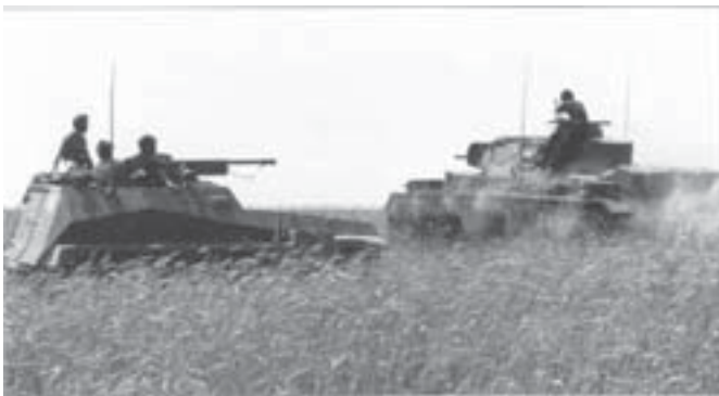
Niemiecki zwiad na polu bitwy.

w tym samym czasie organizował bitwę pod Syczewką, w której zaangażowano kilkakrotnie więcej wojska, lotnictwa, czołgów oraz artylerii niż pod Stalingradem. Bitwę tę Żukow sromotnie przegrał tracąc bezpowrotnie więcej wojska i sprzętu niż Niemcy pod Stalingradem. Dla Niemców klęska Paulusa pod Stalingradem była dotkliwą klęską, ale nie przekreślającą wartości armii niemieckiej. Była to raczej kwestia utraconej dumy niż klęska militarna. Dla Rosjan pod dowództwem Żukowa starta kilku armii, wielkiej masy czołgów i sprzętu wojskowego. Dziś już wiemy, że największe zaopatrzenie w materiały wojskowe i sprzęt dla armii niemieckiej zapewniały „zwycięstwa” Żukowa.