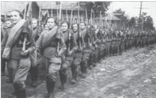
Radziecka jednostka wojskowa złożona z kobiet.

Geniusz wojny, marszałek Żukow, co robi w dniu 5 lipca 1943 roku? Nasz „bohater” po chwili spotkania z Rokossowskim pakuje się i jedzie do Sokołowskiego. Wielki i genialny