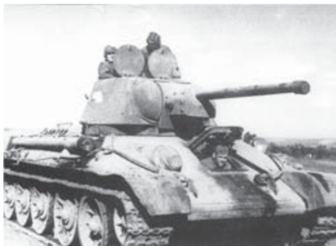
Cołg T-34. Ten typ czołgu by w czasie tej bitwy po obu stronach. Niemcy chętnie używali zdobyczny.

autorem sukcesów. Zazwyczaj „Wielki Wódz” przedstawiany jest jako zwykły prostak, tchórz, brutal, głąb. I to dziwne, bo te wspomnienia to literatura ogólnie dostępna w Rosji! I większość marszałków i generałów z czasu wojny ma takie