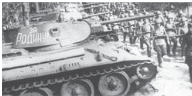
Czołgi T-34 i radziecka piechota.

Z historii II wojny światowej lubię to co było duże, ważne, charyzmatyczne i ciekawe. Jak dla mnie to prawie wszystko co wydarzyło się w latach 1939-1945 zasługuje na uwagę. Lubię historię oceniać z kilku ważnych powodów. Najważniejszym jest