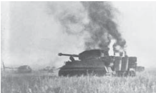
Po bitwie. Wraki czołgów niemieckich.

Kursk to wynik zwycięstwa pod Stalingradem. Po tym sukcesie wojska Frontu Centralnego i Woroneskiego wysforowały się naprzód, ale poniosły duże straty i musiały przejść do obrony. Został utworzony mocny występ skierowany w stronę Niemców. Był to tzw. Łuk Kurski. Niemcy zaplanowali na tym odcinku atak. Miał on przebiegać w sposób następujący: z okolic Orła i Biełgorodu chcieli wyprowadzić dwa uderzenia na Kursk, by w ten sposób rozciąć i oderwać na Łuku Kurskim, a następnie zniszczyć wojska dwóch frontów sowieckich. Wywiad sowiecki bardzo szybko zdobył plany niemieckich.