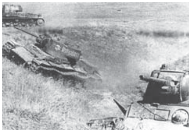
Atak radzieckich czołgów.

oni wiedzą, że akurat Żukow był tym zwycięskim marszałkiem spod Stalingradu i Kurska? Odpowiedź wydaje się dość dziwna, ale zawsze praktycznie pada ta sama. Jak to skąd? Od samego Żukowa. Przecież on sam napisał jak to genialnie okrążył Niemców pod Stalingradem i przegonił spod Kurska. W ostatnich latach najczęściej w tej sprawie uczynił Wiktor Suworow. Mimo wielkich kontrowersji wokół swojej osoby nawet najwięksi jego przeciwnicy muszą przyznać, że jako były agent GRU został doskonale nauczony jednej rzeczy: doskonałego analizowania materiału jakim dysponuje. A demaskacji „geniuszu” Żukowa dokonał w bardzo prosty sposób.