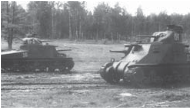
Mit o tym, że Kursk to tylko T-34.