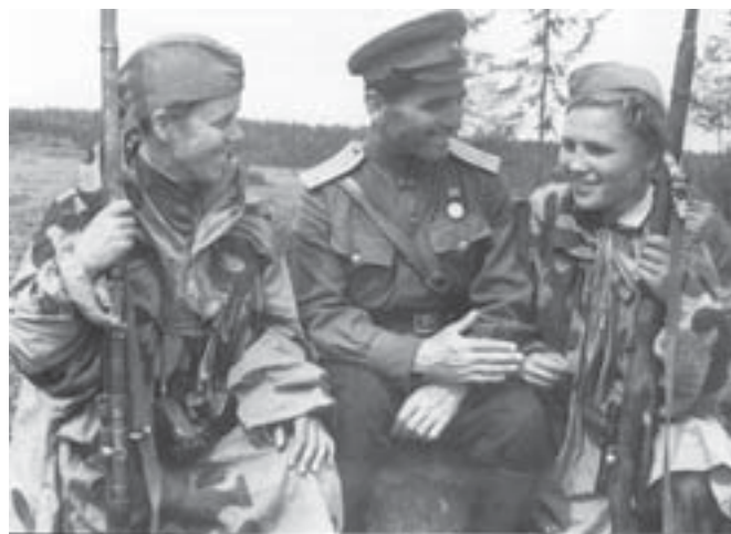
Kobiety - snajperki .