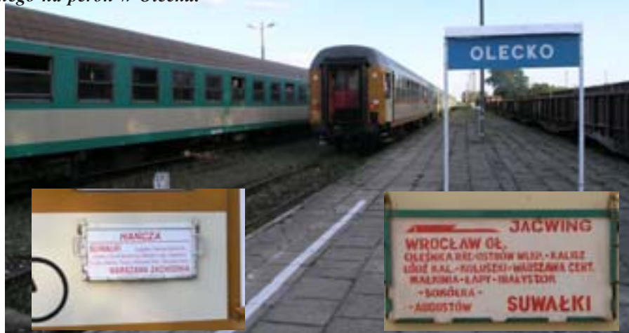
Dwa pospieszne obok siebie. Na dworcu stały wtedy jeszcze dwa pociągi towarowe, tak że jednocześnie były zajęte aż cztery perony.

Nie jest to, niestety, stały obrazek naszego krajobrazu, a tylko awaryjna sytuacja spowodowana remontem mostu kolejowego na trasie Suwałki-Białystok. A szkoda. Wielu mieszkańców naszego grodu byłoby uradowanych sytuacją, gdyby z Olecka zaczęły kursować pociągi „jak za dawnych dobrych czasów”.