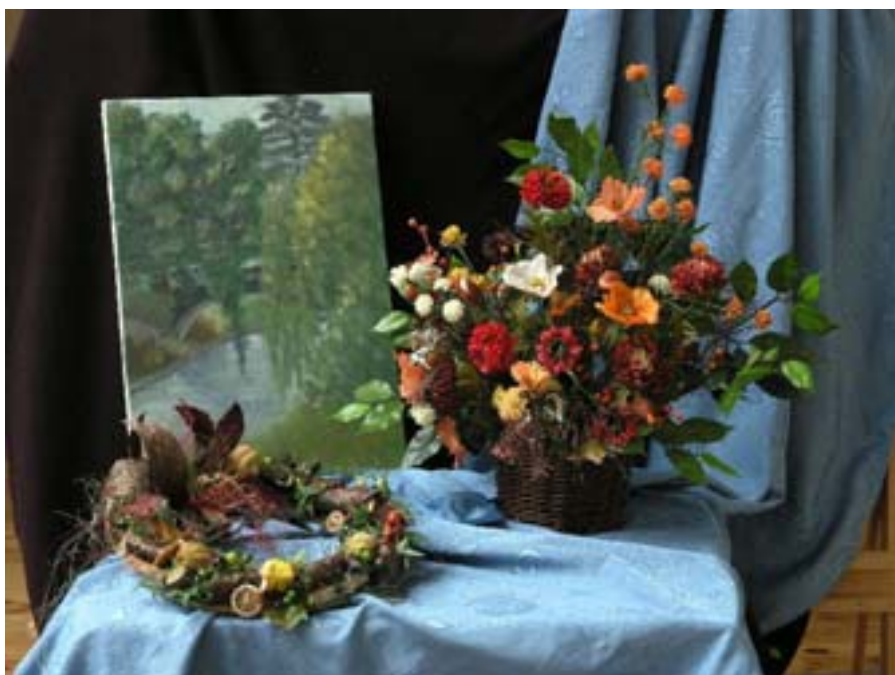
Wystawę prac nadal można obejrzeć w holu kina Regionalnego Ośrodka Kultury w Olecku „Mazury Garbate”

nież szkolenia z zakresu projektowania i realizacji ogrodów przydomowych. Melanż wiedzy, talentu i pracy dał interesujący efekt – prace z poszczególnych kursów można obejrzeć na wystawie podsumowującej szkolenia. W holu Regionalnego Ośrodka Kultury i Sztuki w Olecku „Mazury Garbate” można podziwiać imponującą ilość prac utalentowanych olecczan.