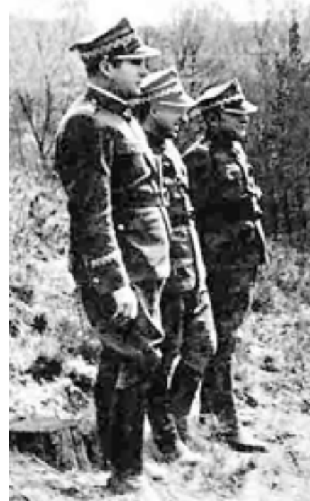
Świerczewski, Spychalski, Rola-Żymierski

20 lipca 1944 r. komunistyczna Delegatura KRN powołuje tzw. Polski Komitet Wyzwolenia Narodowego. Dzień później KRN wydaje „ustawę” o utworzeniu PKWN i nazywa go „tymczasową władzą wykonawczą dla kierowania walką wyzwolenczą narodu, zdobycia niepodległości i odbudowy państwowości polskiej”. Przewodniczącym PKWN, jak już wcześniej wspominałem, zostaje Edward Osóbka-Morawski, a jego zastępcami Wanda Wasilewska i Andrzej Witos. Tego samego dnia wojska sowieckie wkraczają do Chełma Lubelskiego, mając już przygotowany odpowiedni grunt polityczny.