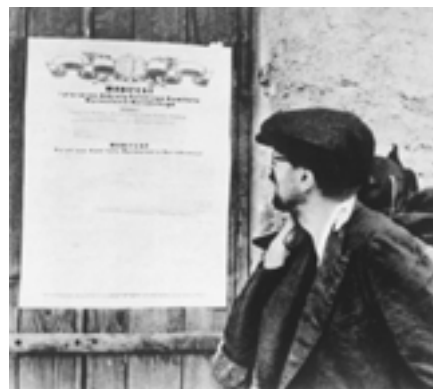
Słynne zdjęcie z czytającym Manifest Lipcowym człowiekiem

Postacią szczególną wśród członków KRN była niewątpliwie przywołana tu Wanda Wasilewska. Przed wojną związana ze środowiskiem KPP, na jesieni 1939r. „zerwała więzy” z Polską „reakcyjną” i „wybrała wolność” w „ojczyźnie proletariatu”. Przyjęła sowieckie obywatelstwo, w którym wytrzymała do końca życia. Została członkinią Wszechrosyjskiej Komunistycznej Partii (bolszewików) i Związku Pisarzy Sowieckich. Stalin „wybrał” ją już w 1940 r. do Rady Najwyższej ZSSR i wyznaczył jej rolę swego rodzaju „ambasadora” do spraw polskich, którą to rolę pełniła ze szczególną gorliwością. Kierowała „polskim” Teatrem Dramatycznym w okupowanym Lwowie, pisała „jedynie słuszne” reportaże i opowiadania. Na polecenie Stalina założyła tzw. Związek Patriotów Polskich – karykaturalne zaprzeczenie patriotyzmu polskiego – i asystowała w powołaniu kolejnych in-