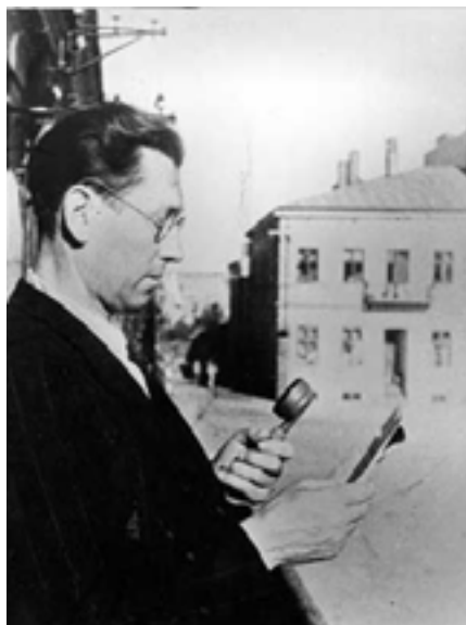
Odczytanie przez radio manifestu PKWN Rzeszów 1944.

wojną podjął współpracę z wywiadem radzieckim. Było to wypowiedzenie posłuszeństwa wodzowi naczelnemu wojska polskiego w warunkach wojny i faktyczne podporządkowanie się siłom zbrojnym obcego państwa, które okupowało część Polski!