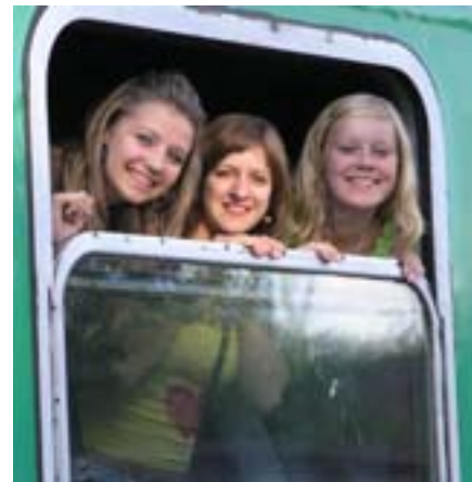
Uradowane pasażerki w oknie przedziału.

W dniu 10 sierpnia ok. godz. 18. dworzec PKP w Olecku ożył. Po raz pierwszy doszło tu do niecodziennego spotkania dwóch pociągów pospiesznych, pierwszego „Hańcza” – relacji Suwałki-Warszawa i drugiego „Jaćwing” relacji Suwałki-Wrocław.