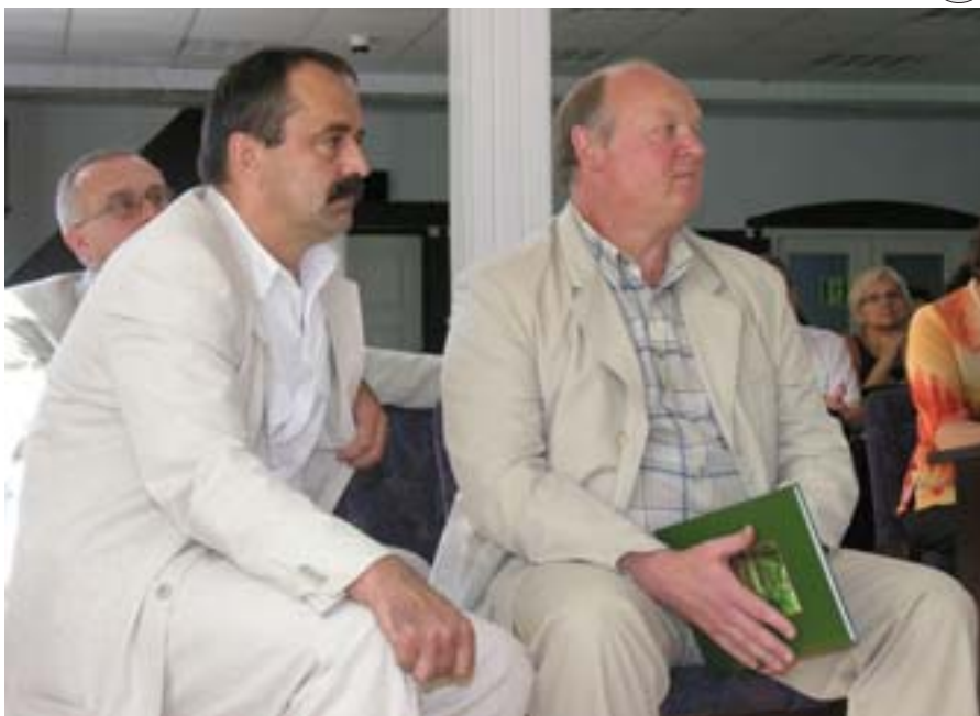
Burmistrz Olecka z przedstawicielem Litwy.

Podczas konferencji beneficjenci otrzymali album, który ilustruje temat przewodni projektu, tj. piękne ogrody Ziemi Oleckiej. Zwieńczeniem dotychczasowych działań będzie utworzenie biura współpracy transgranicznej.