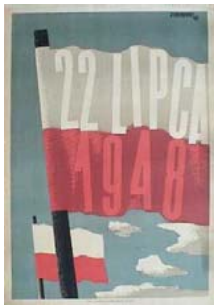
22lipca1948 - plakat rocznicowy

Manifest podpisali członkowie PKWN z przewodniczącym Edwardem Osóbką-Morawskim i wiceprzewodniczącymi Wandą Wasilewską i Andrzejem Witosem na czele.