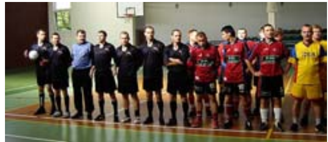
Zawodnicy z Olecka i z Elbląga.