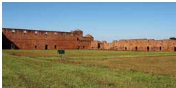
Ruiny misji w Jesus

W Encarnación zjadłem trochę baraniny (żeby nie myśleć o tej krowie) i rozkoszowałem się słodkim maniakiem (odmiana ziemniaka). Kupiłem też smaczne chipy – bułeczki robione przy użyciu mąki z manioku, jajek i sera.