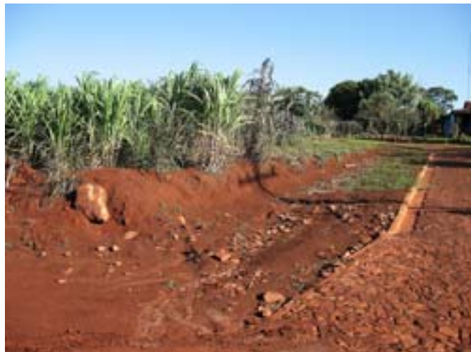
Droga do Jesus i trzcina cukrowa

Kiedy wyszedłem z terenu misji poszedł do mnie dzieci i próbowały sprzedać kilka figurek i jakieś antyki, które tak naprawdę wykonane były zapewne wczoraj. Po chwili dołączyły do nich inne dzieci – uczniowie wracający ze szkoły. Chyba dawno nie było tu turystów, bo dzieciaki wydawały się takie zawstyżone. Nic od nich nie kupiłem, ale dały się sfotografować.