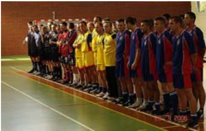
Reprezentacje - otwarcie.

Dnia 29.09.2006 r. na hali sportowej ZST w Olecku odbyły się eliminacje VIII Mistrzostw Województwa Warmińsko – Mazurskiego strażaków w halową piłkę nożną. Na eliminacje oprócz gospodarzy zgłosiły się następujące drużyny: Komendy Miejskiej PSP w Elblągu, Komendy Powiatowej PSP