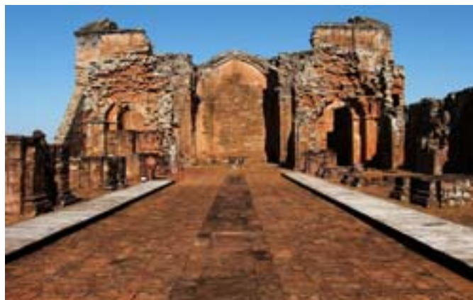
Ruiny misji w Trinidadzie

Misje musiały się jednak bronić przed napaściami z zewnątrz np. w 1641 roku wojska misji pobili handlarzy niewolników z portugalskiej kolonii Sao Paulo. Działalność jezuitów chroniła interesy Indian do 1767 roku, kiedy zakon został rozwiązany, a misjonarze wydaleny z Ameryki Łacińskiej.