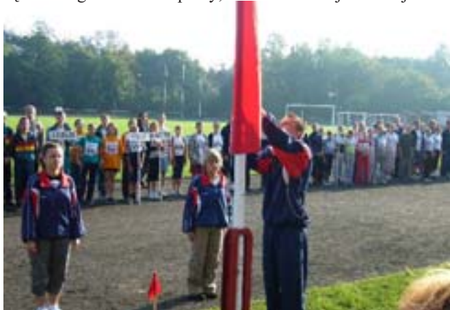
Otwarcie zawodów - flaga na maszt.