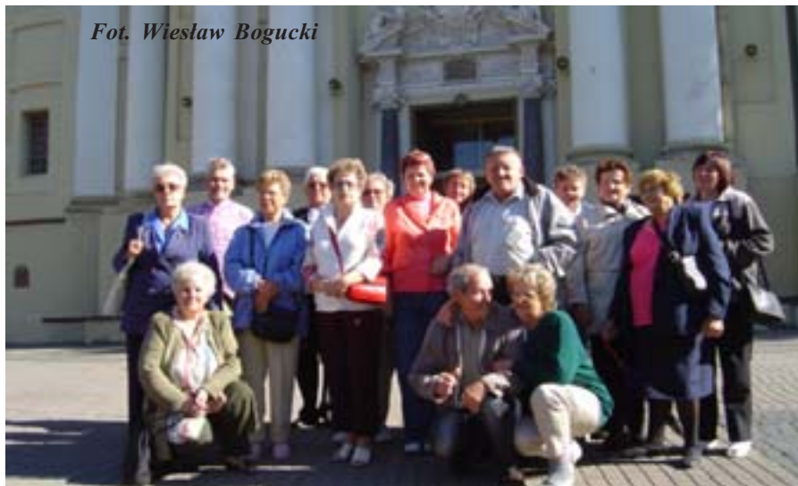
Na zdjęciu: Grupa olecczan przed polskim kościołem pw. Św. Piotra i Pawła.