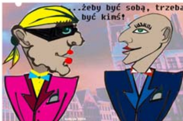
Rys. W.B. Boltryk