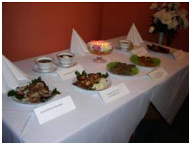
6 potraw z plebiscytu.