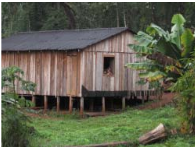
Chata robotników leśnych w dżungli

Z podróży po Argentynie, Urugwaju, Paragwaju, Brazylii – Andrzej Malinowski.