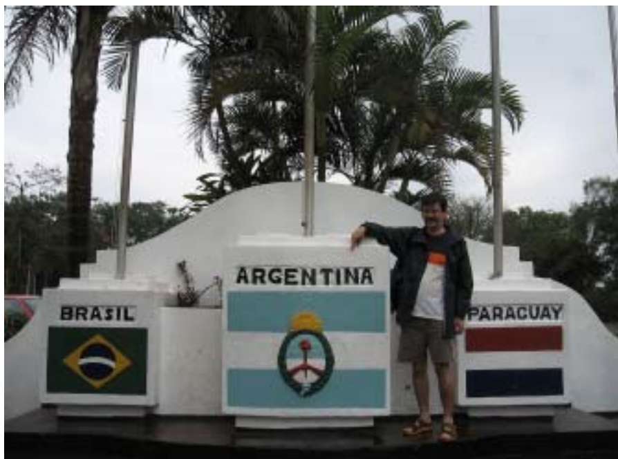
W tej chwili jestem w Argentynie

Ja i jeszcze kilku innych śmiałków – Argentyńczyków – wyruszyliśmy ciężarówką w poszukiwaniu nowych doznań i przygód w dziewiczej, chociaż już przetrzebionej dżungli tego rejonu świata. Było mokro i ślisko. W pewnej chwili myślałem, że ciężarówka się przewróci i szybko zakończymy naszą jeszcze nie rozpoczętą przygodę. Kierowca okazał się jednak znakomitym znawcą argentyńskich dróg i o żadnym niebezpieczeństwie nie mogło być mowy. A dżungla stawała się coraz bardziej interesująca. Szkoda tylko, że wycina się tu tak dużo drzew (praktykuje się rolnictwo żarowe). Państwo