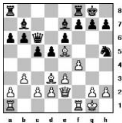
Diagram 1. (zad.26, 2p.)

Uporządkowana wiedza na temat pozycji szachowych pozwala arcymistrzowi szybko wykonać właściwe posunięcie. Pozycja przedstawiona poniżej (diagram 1) pochodzi ze słynnej partii rozegranej w 1889 roku między Emanuelem Laskerem i Johannem Bauerem. Choć nowicjusz musiałby dogłębnie przeanalizować pozycję, by dostrzec wygrywające posunięcie białych, każdy arcymistrz dostrzegłby je natychmiast.