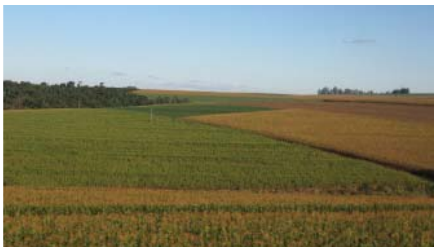
Południe Brazylii to tereny uprawne

O godz. 11.40 wyjechałem z hostelu na dworzec autobusowy w Puerto Iguazu. Dworzec podobny jak w Olecku. Kilka byle jakich stanowisk, ale tutaj chociaż jest okap i w razie deszczu nie pada na głowę! Oddałem swój paszport panu w okienku, żeby wypisał mi bilet. Okazało się, że musi on najpierw powiadomić przejście graniczne, że konkretnie ten a nie inny autobus będzie mnie przewoził.