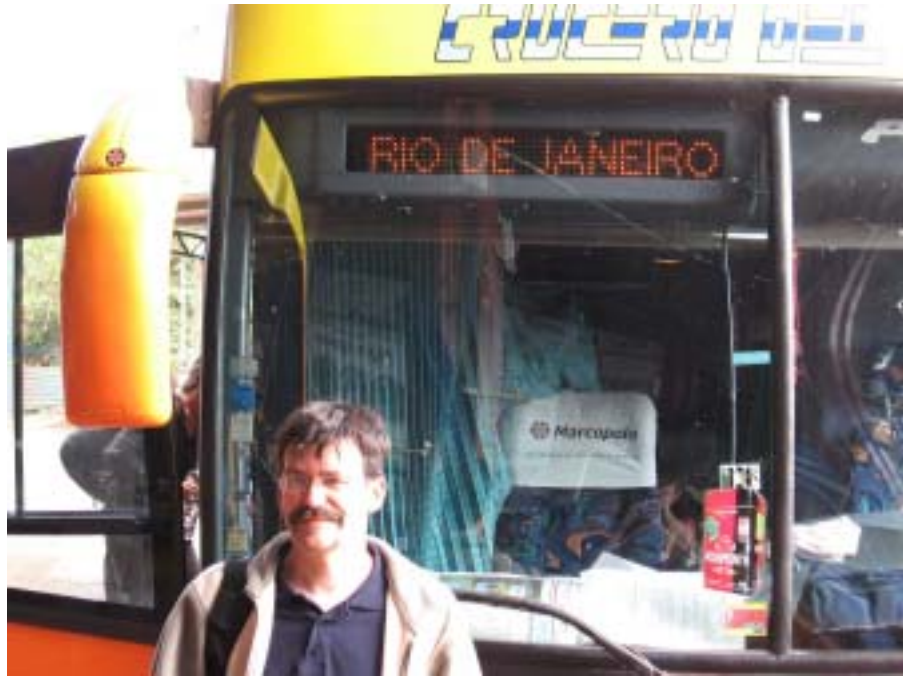
Tym autobusem pojechałem do Brazylii

W końcu XX wieku ponad 50 milionów Brazylijczyków żyło w ubóstwie. Teraz też miliony z nich żyje w fawelach – dzielnicach nędzy. Brazylia boryka się z przeludnieniem miast, systemem ochrony zdrowia, zachwianiem równowagi śro-