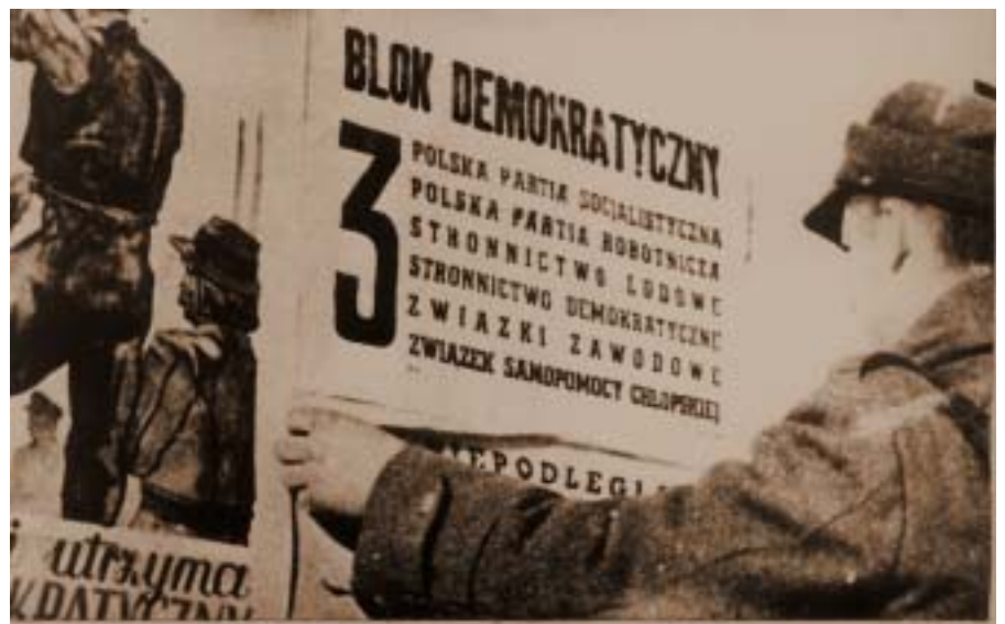
Zdjęcie propagandowe, żołnierz LWP rozklejający plakaty wyborcze.

Wystawę można zwiedzać w siedzibie oleckiego Nadleśnictwa, ul. T. Kościuszki 32, od 27 listopada do 11 grudnia 2006 r. w godz. 9.00 – 14.00. Serdecznie zapraszamy