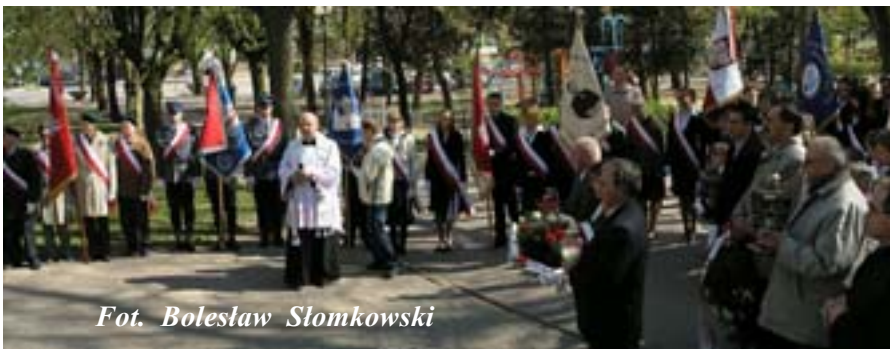
Fot. Bolesław Słomkowski

MAJSTER MARKET BUDOWLANY M. Pietraszewski CENTRUM HANDLOWE – Aleje Lipowe 1B