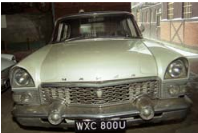
Czajka - samochód komunistycznych dygnitarzy