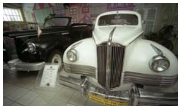
ZiL – defiladowy samochód Józefa Stalina, który подарował Bolesławowi Bierutowi.