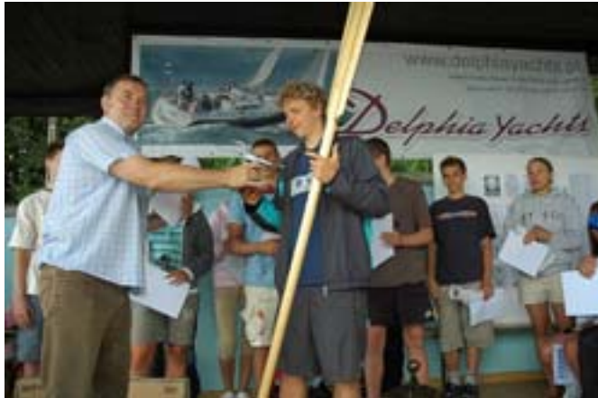
Zwycięzca otrzymał łódź wiosłową.