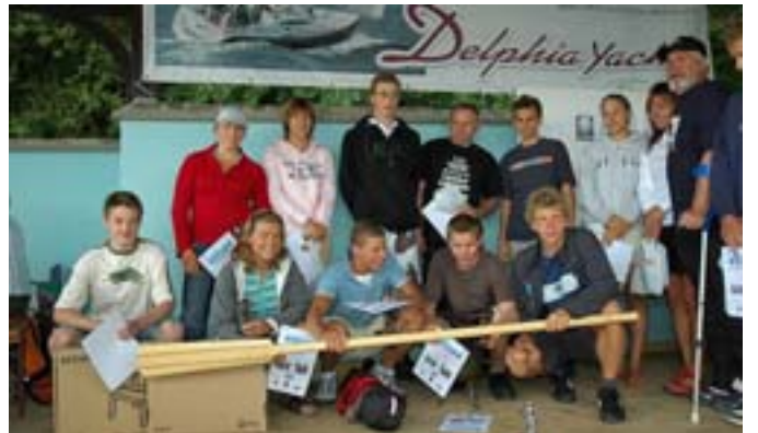
Wspólna fotografia uczestników.