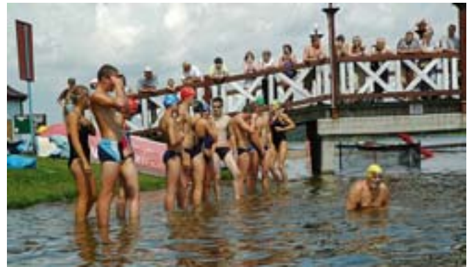
Na starcie do maratonu.