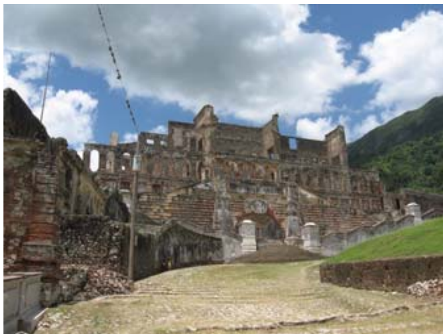
Milot, Sans Souci

ale pokonaliśmy tę trasę maszerując serpentynami przez dżunglę. Na szczęście droga była kamienista. Jacyś goście chcieli zawieźć nas tam na swoich konikach i osłach, ale nie skorzystaliśmy z ich propozycji – byli bardzo nachalni. Po drodze mijaliśmy pojedyncze domy i małe wioski spotykając rozmaitych ludzi. Kobiety z praniem niesionym w wiadrach na głowie, mężczyźni wracających z polowania, dzieci myjące się w strumieniu. Ludzie mili. Oferowali nam do kupienia wodę, owoce, jakieś tam paciorki itp. Kupiliśmy małe banany za 1 dolara (8 sztuk). Większość dzieci na nasz widok krzyczała: „Hej, biały! Daj dolara!” Zastanawiałem się dlaczego tylko dolara, a nie np. dwa czy trzy?! Czyżby po angielsku nie znały innych liczebników?! Pod górę wchodziliśmy 2,5 godziny, schodziliśmy 1,5.