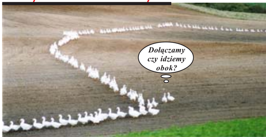
No to gęsiego...