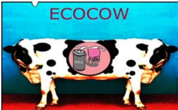
Rys. Wiesław B. Boltryk

Obecnie w strefie pozostały jeszcze działki o powierzchni 3,8 ha.