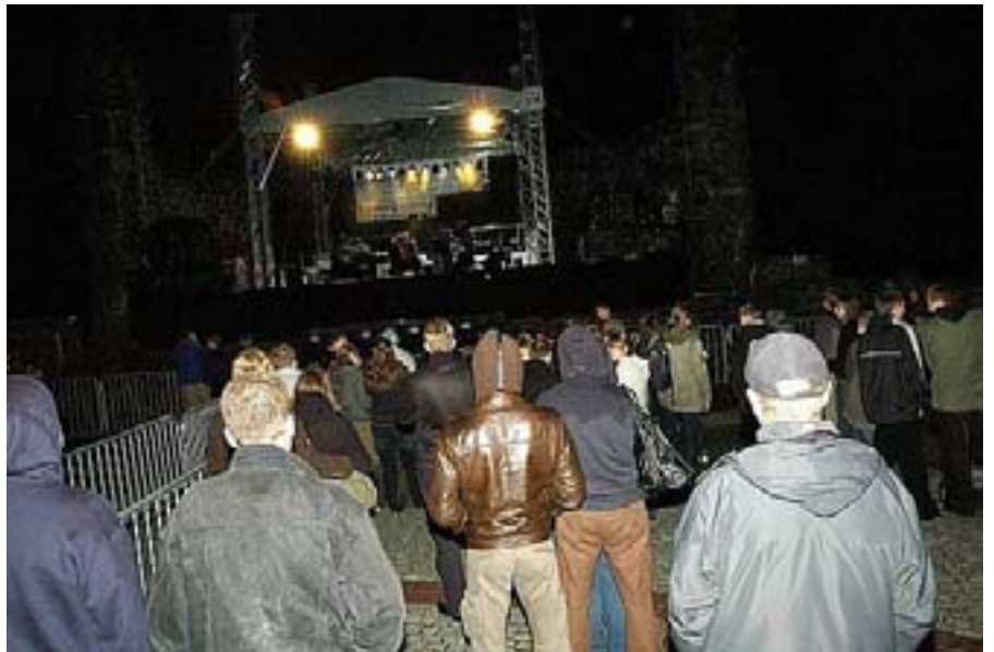
Zespół „Gurzof” na scenie i wręczenie zespołowi wyróżnień.