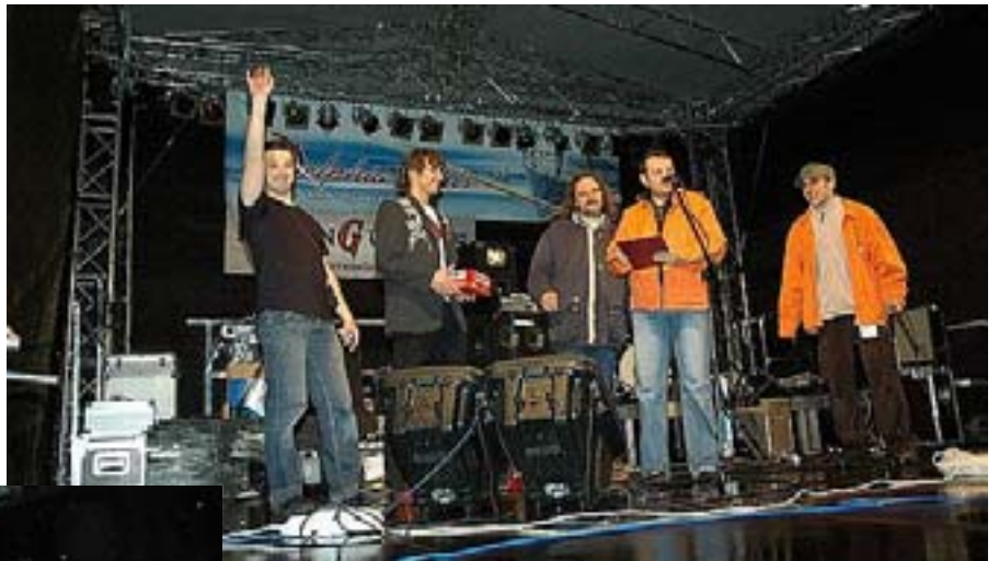
Występ zespołu „Apteka”