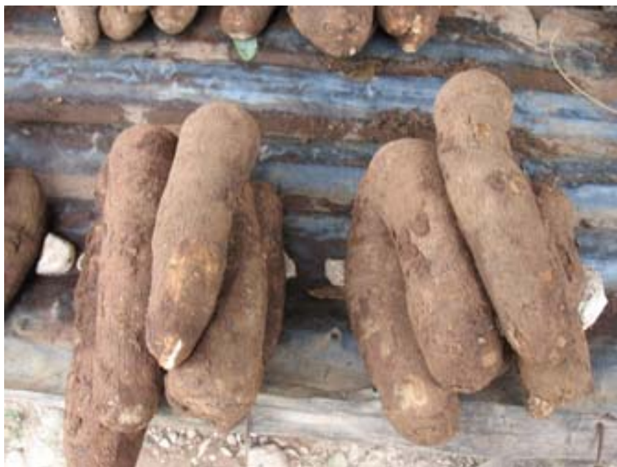
Bataty (słodkie ziemniaki)