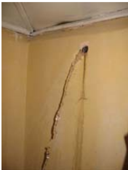
Barahona. Prysznic w mojej łazience