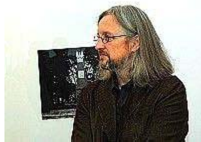
Fot. Józef Kunicki

Wystawa ta jest jednak również, a może bardziej, wydarzeniem artystycznym. Pomimo tego, że w zasadzie jest retrospektywna, to przecież nie została ona zorganizowana tylko dla tego celu. Prezentowane fotografie są źródłem nowego przedstawiania rzeczywistości. Ich bohaterem, albo mówiąc literacko – podmiotem artystycznym – jest miasto. Obraz jego jest subiektywny. Każdy bowiem widział je inaczej. Ale Z. Pławski miał odwagę i dar by przedstawić je na swój sposób! Ktoś już raz z rzędu czarno biała fotografia (oraz monochromatyczne malarstwo) pokazują, że w zasadzie tylko walor może ukazać nostalgię i zadumę. Patrząc na te obrazy czuje się wewnętrzny spokój i zjawia